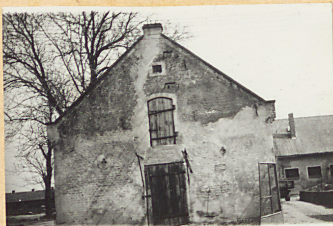
1. Elewacja szczytowa zach.