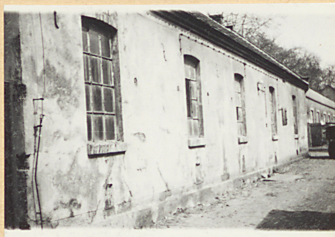
2. Elewacja pd.