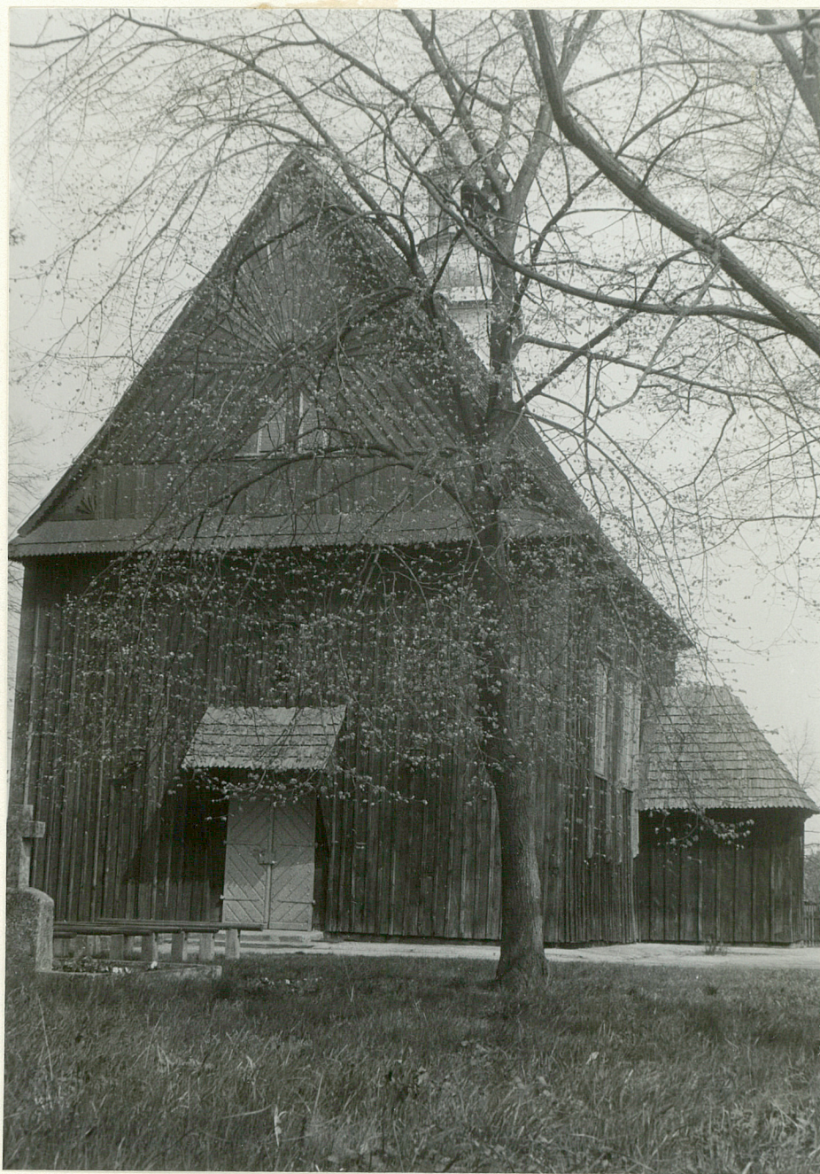
3. KOSCIÓŁ 1792