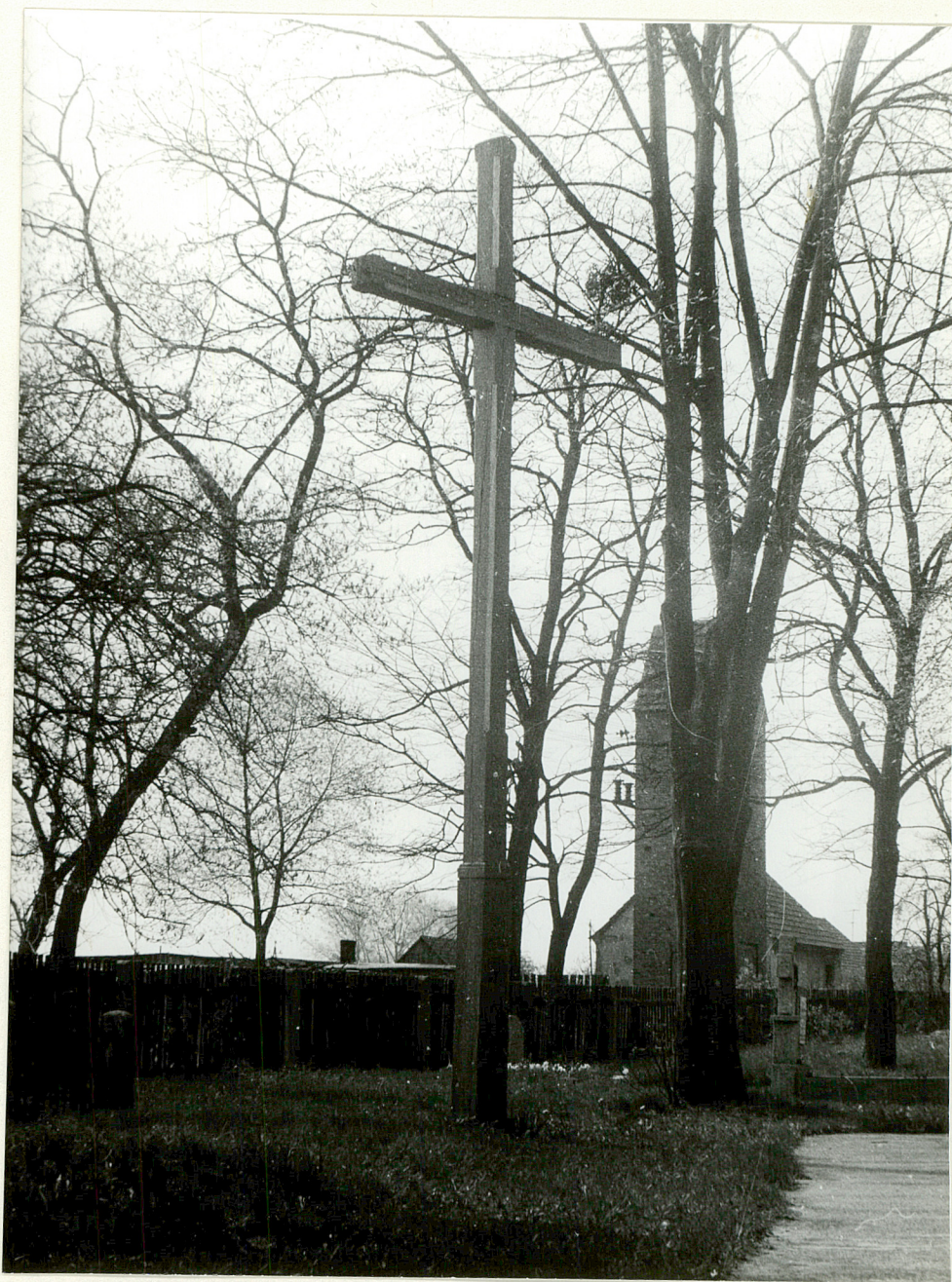
2. KRZYŻ CMENTARNY