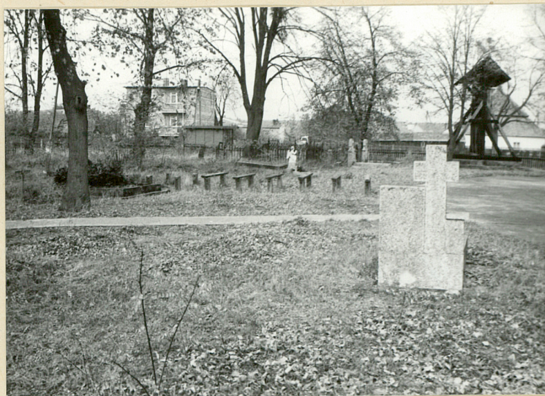
5. Nagrobki na terenie przykościelnym