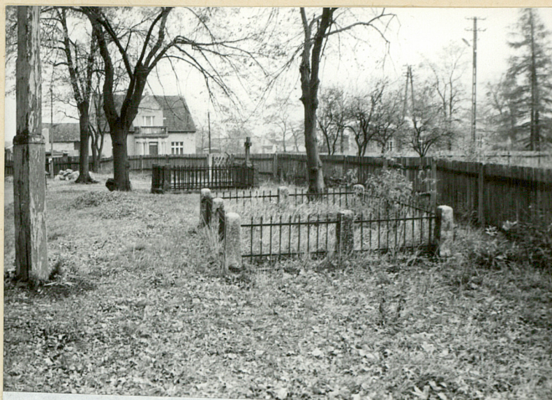
4. Miejsce dawnych pochówków. Mogiły.