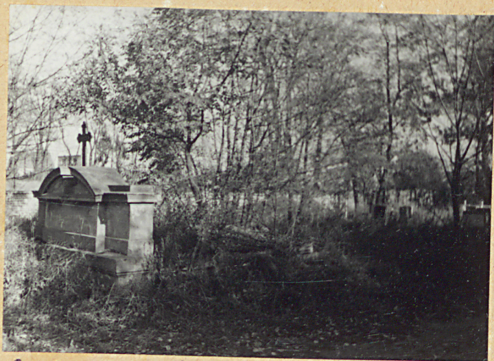
6-9. ZESPÓŁ 17 ZANIEDBANYCH GROBOWCÓW RODZINNYCH