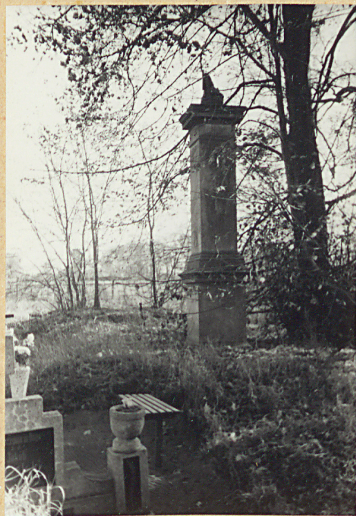
5. NAGROBEK W FORMIE MUROWANEGO STUPA Z FRAGMENTEM RZĘBY