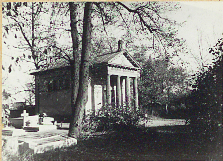
2. KAPLICA RODZINY GŁOGOWSKICH