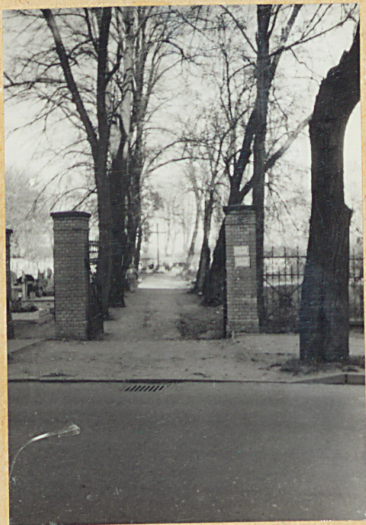
4. BRAMA I ALEJA GK.