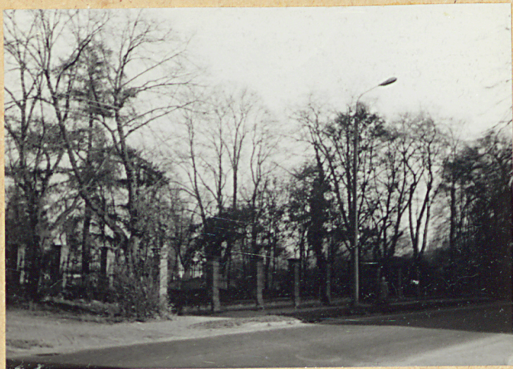
1. WIDOK OGÓLNY OD PD.-ZACH.