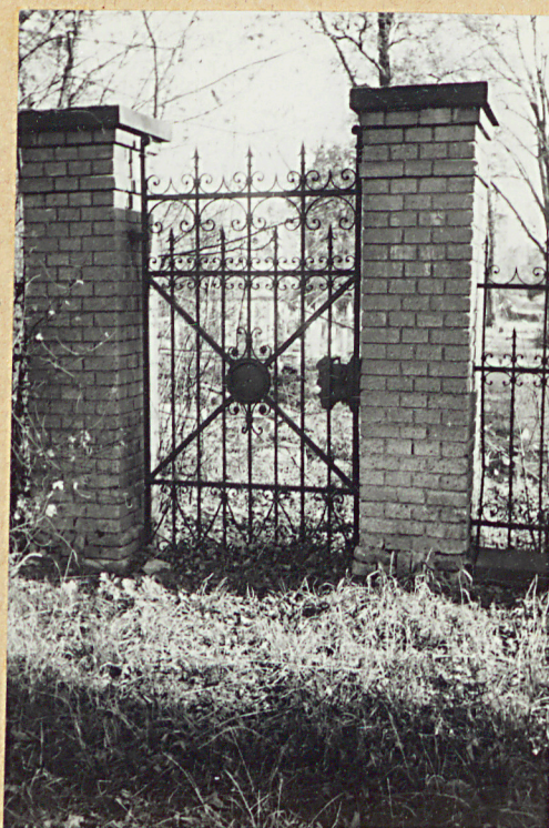
11. MIĘDZYWANA FURTKA W OGRODZENIU OD ZACH.