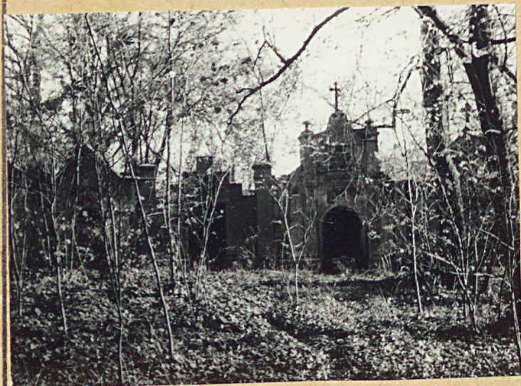
3. ZESPÓŁ ZAMIEDBANYCH GROBOWCÓW RODZINNYCH