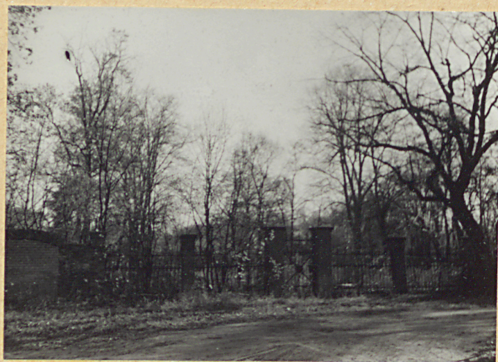
12. WIDOK NA CMENTARZ OD ZACH.