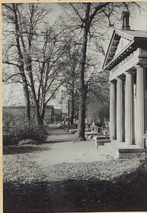
10. WIDOK NA RESZTKI KLEII POPRZECZNEJ