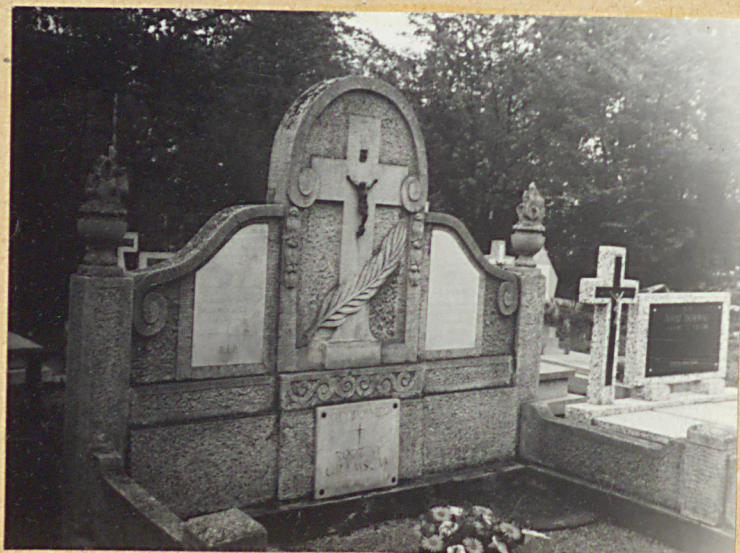
13. GRÓB RODZINY GRAMÓW