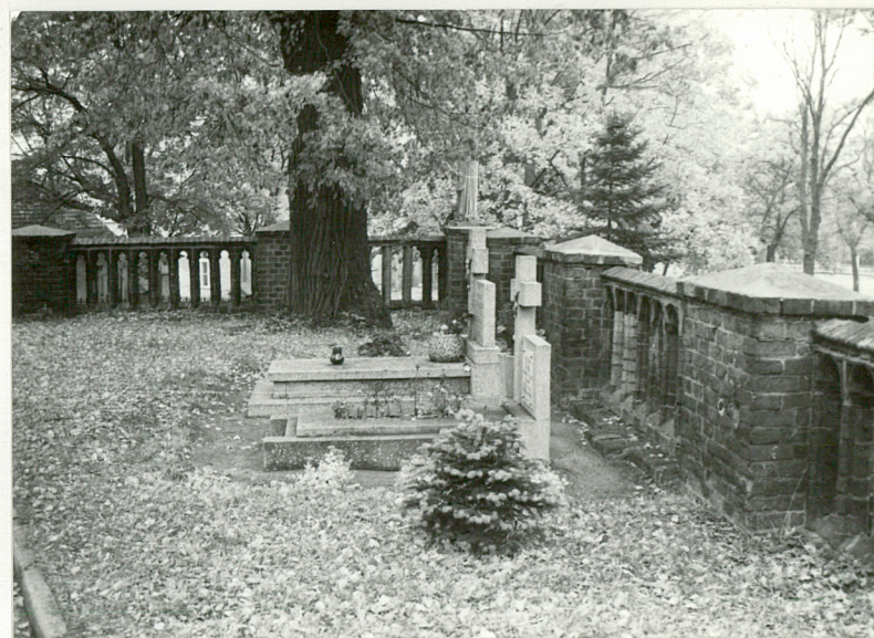
2. Nagrobki na terenie przykościelnym