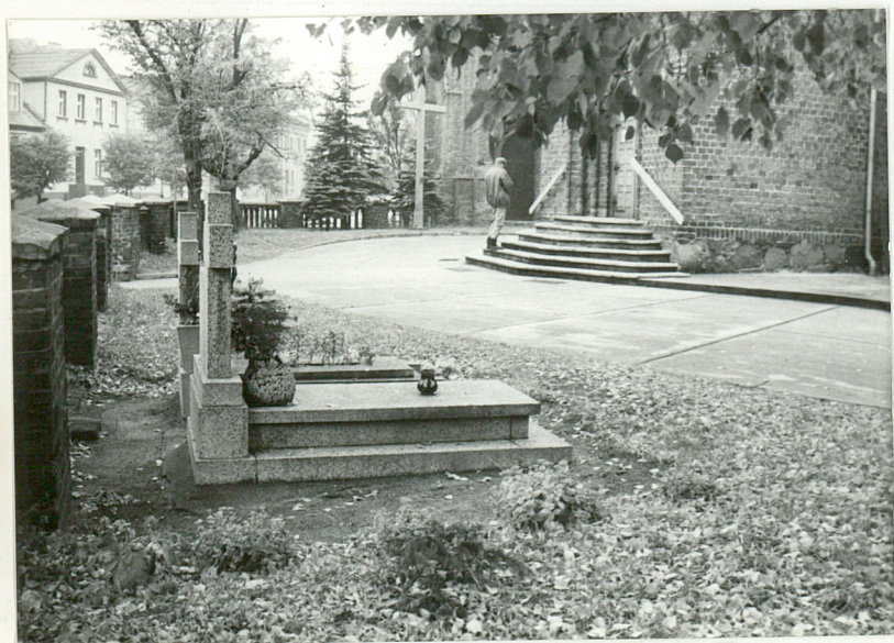
3. Nagrobki na terenie przykościelnym