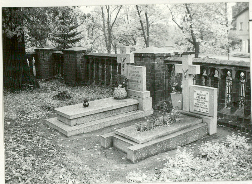
1. Grób Kosynierów Miłosławskich - teren przykościelny