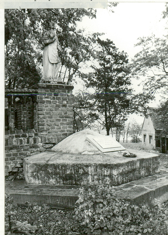
4. Nagrobki na terenie przykościelnym