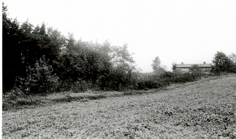
WIDOK OGOLNY CMENTARZA