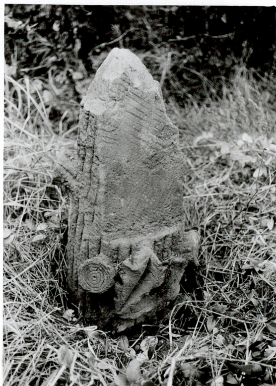
NAGROBEK NN piaskowiec ucięte drzewo - symbol przerwane- życia / 2 /