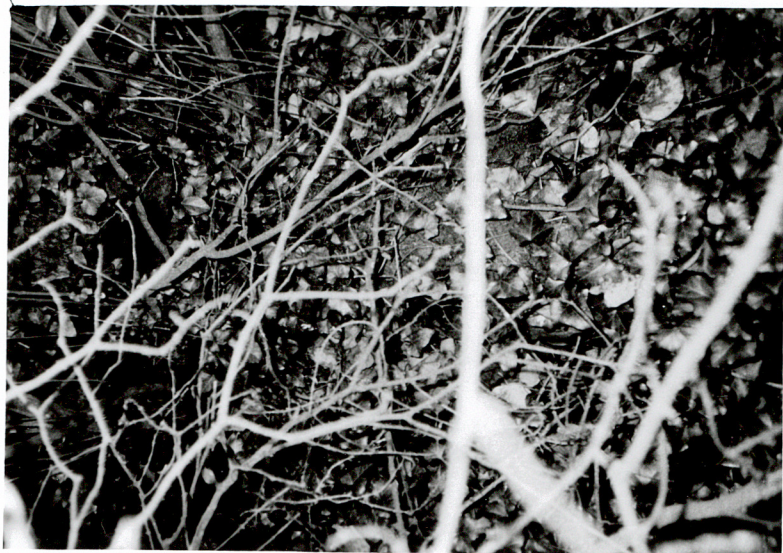
FRAGMENT NAGROBKA NN wśród samosiewów lilaka / 7 /

3. Zawartość wkładki (nazwa obiektu lub materiału uzupełniającego) FOTOGRAFIE