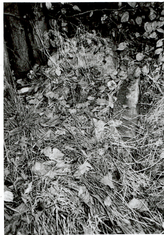
OBMUROWANA MOGIŁA NN sztuczny kamień / 4 /