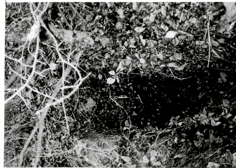
FRAGMENT GROBOWCA NN mur. z cegły, porośnięty bluszczem i borówką / 6 /