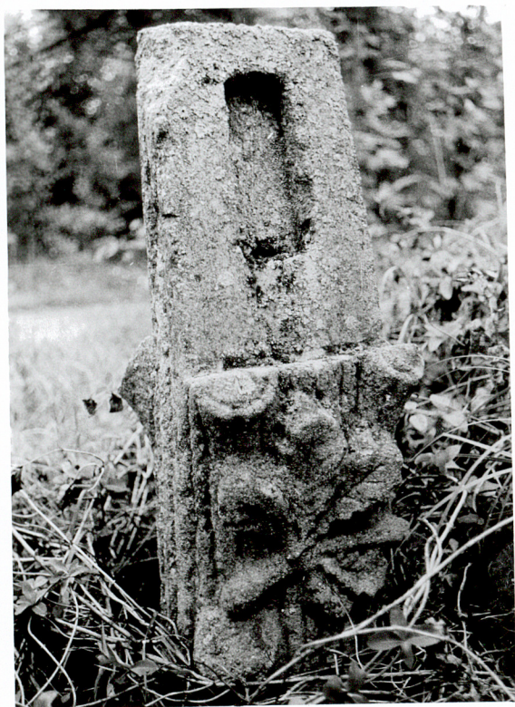
NAGROBEK NN sztuczny kamień z motywem liści dębu / 1 /