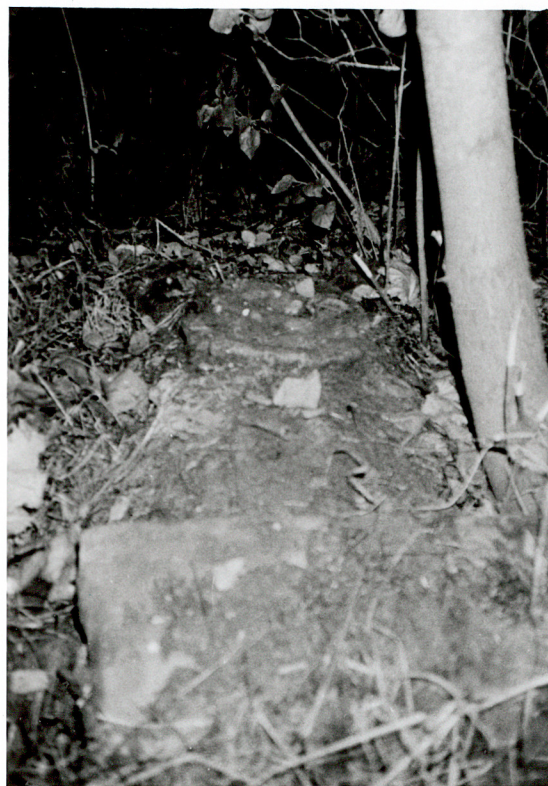
FRAGMENT NAGROBKA NN piaskowiec / 3 /

3. Zawartość wkładki (nazwa obiektu lub materiału uzupełniającego) FOTOGRAFIE