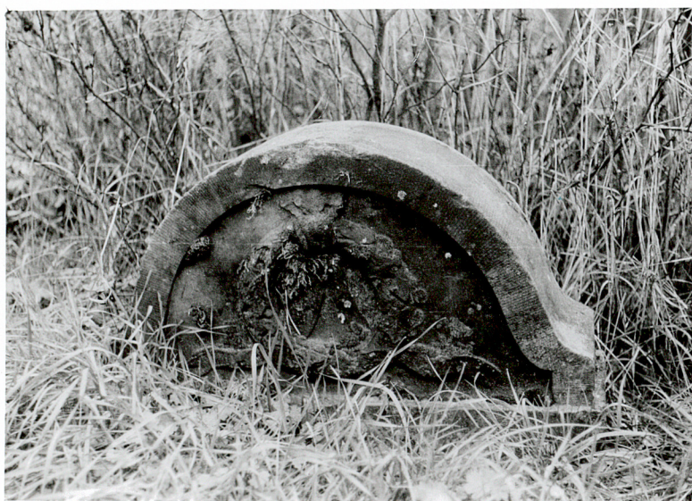
FRAGMENT NAGROBKA NN z motywem wieńca laurowego; piaskowiec / 5 /