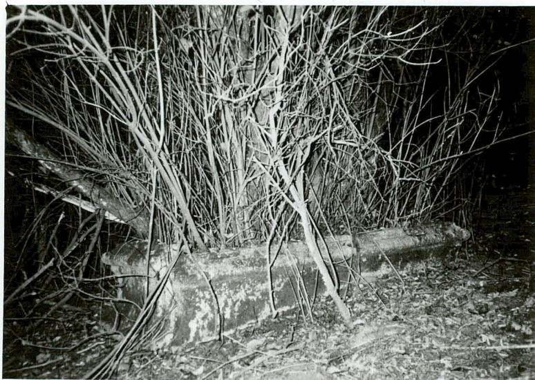
OBMUROWANA MOGIŁA NN przerośnięta samosiewami / 2 /

3. Zawartość wkładki (nazwa obiektu lub materiału uzupełniającego) FOTOGRAFIE