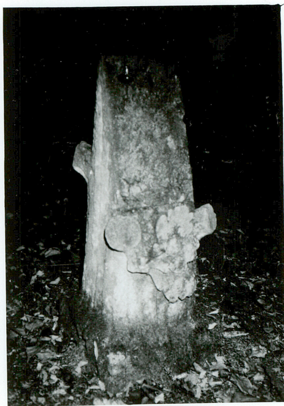
NAGROBEK NN pień dębowy - symbol przerwanego życia; piaskowiec / 1 /