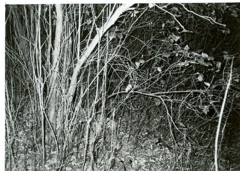
PARA OBMUROWANYCH MOGIŁ NN / 4 /