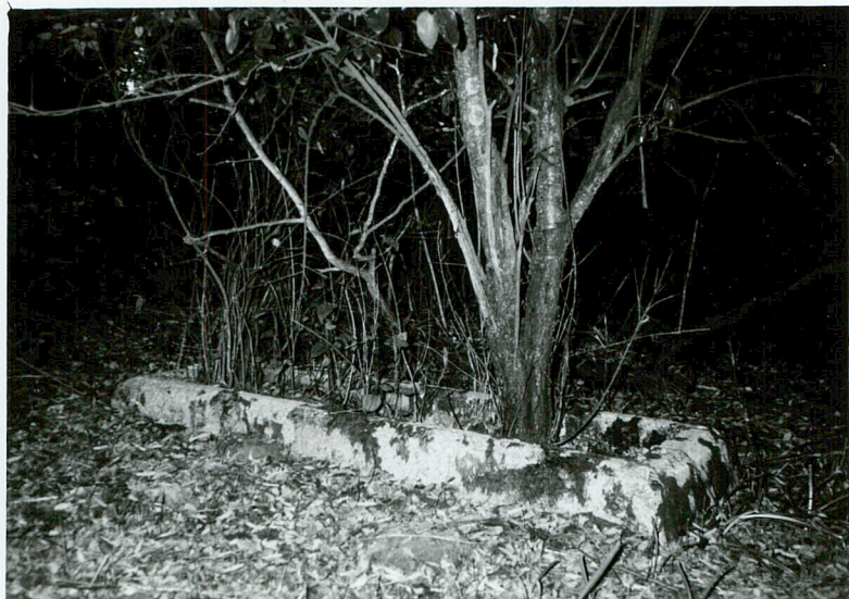
MOGIŁA NN OBUDOWANA lastrico / 5 /