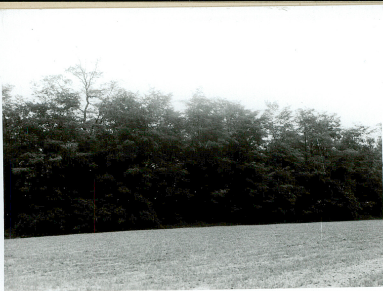
WIDOK OGÓLNY Z DROGI ORCHOWO-GAŁCZYNEK