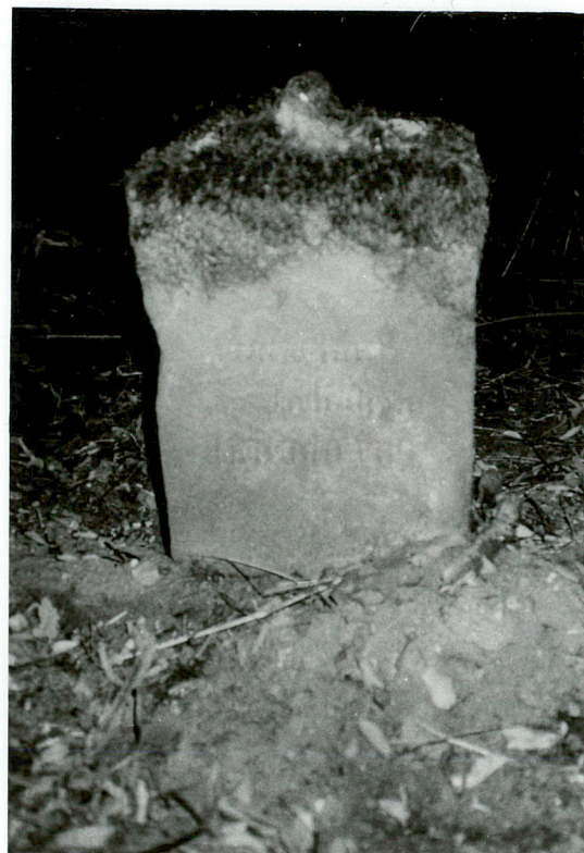
FRAGMENT NAGROBKA NN piaskowiec, żeliwny krzyż odłamany inskrpcja pisana gotykiem nieczytelna / 6 /