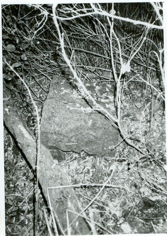
FRAGMENT NAGROBKA NN piaskowiec / 7 /