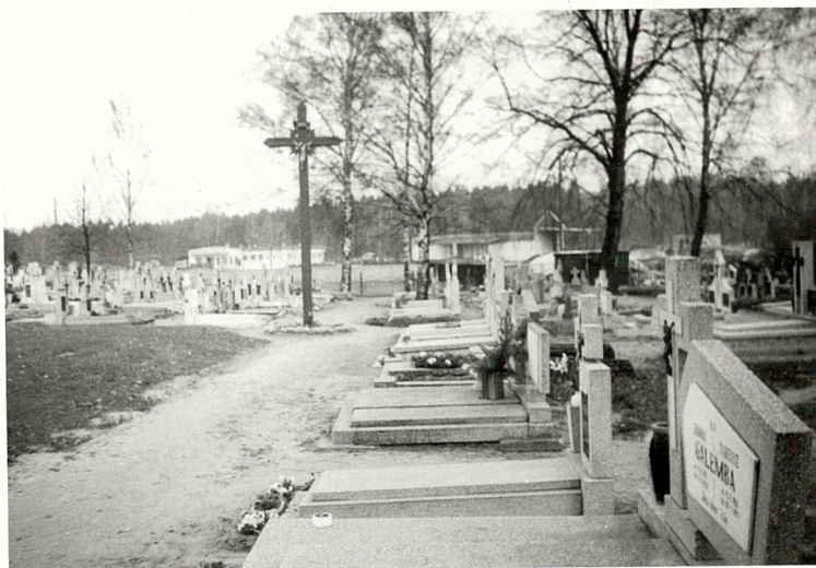
2. WIDOK NA NOWĄ CZĘŚĆ CMENTARZA