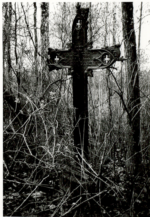
4. KRZYŻ ŻELIŃNY