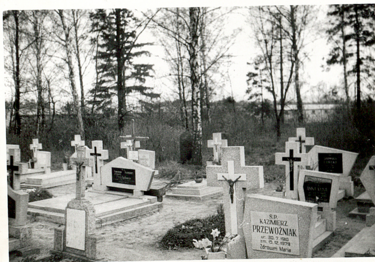
3. WIDOK NA STARĄ CZĘŚĆ CMENTARZA