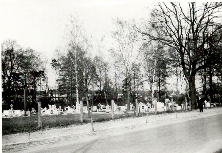
1. WIDOK OGÓLNY