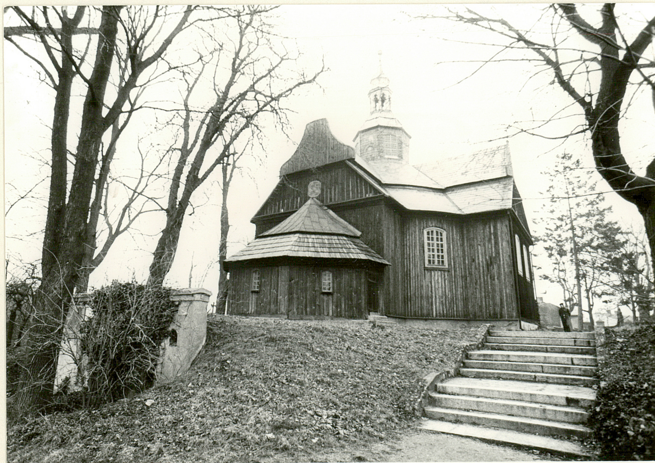
4. Widok kościoła od strony Pd-zach.