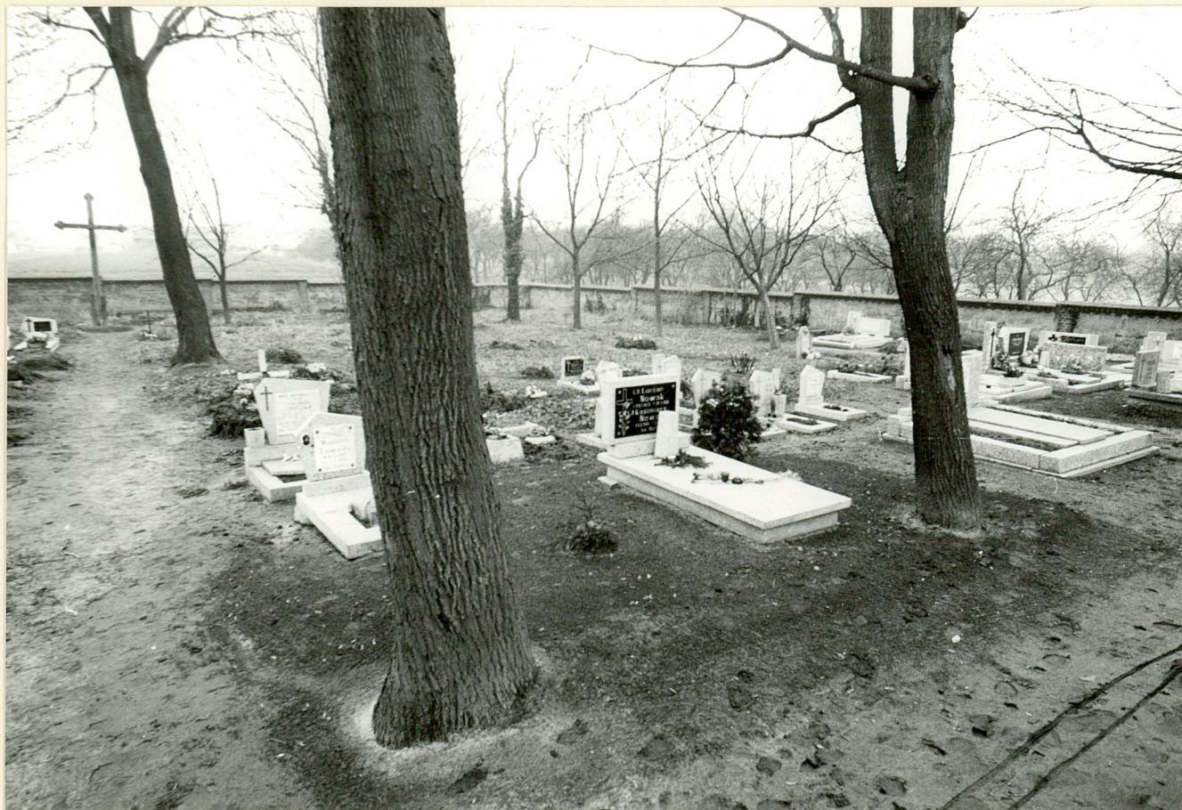
2. Widok na kwaterę w Pd części cmentarza