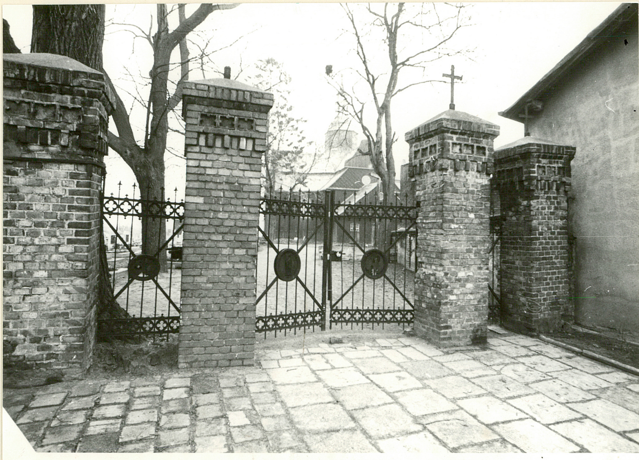
1. Brama główna cmentarza przykościelnego