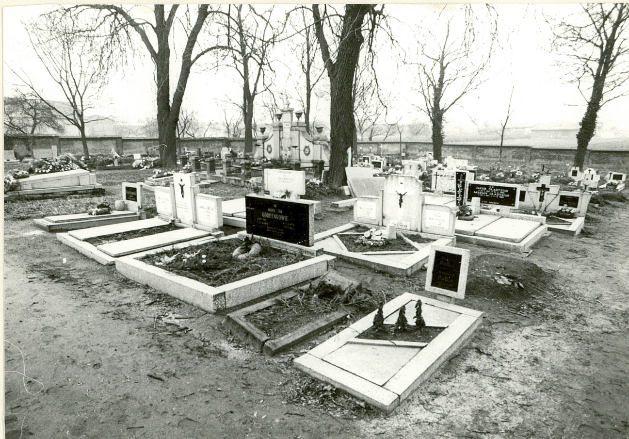
3. Widok na fragment cmentarza z ceglanym murem