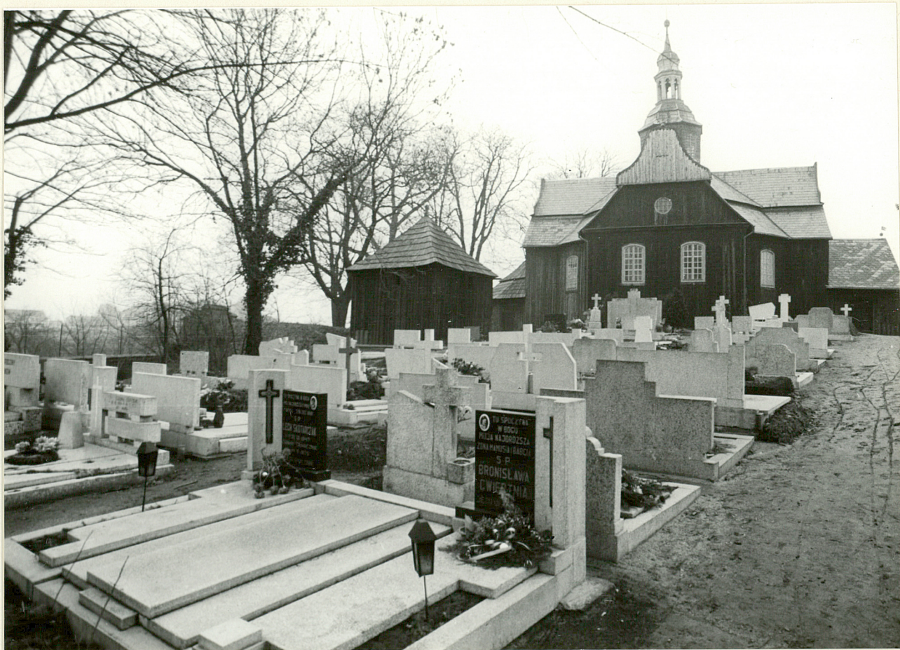
5. Widok na kwaterę Pn-zach. i Pd elewację kościoła