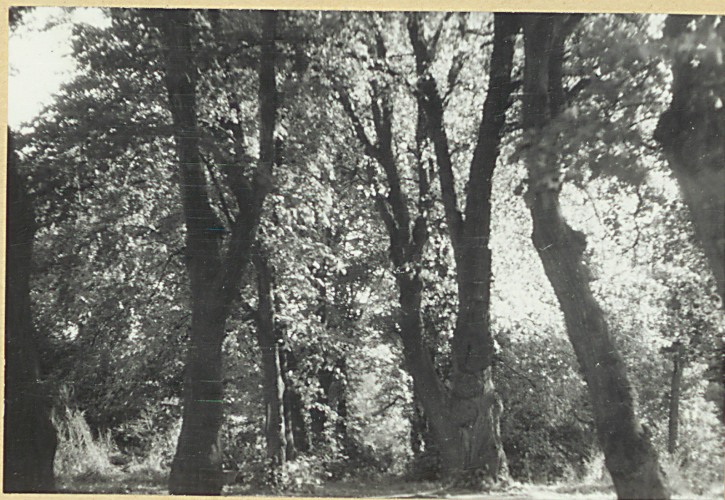
Główne wejście na cmentarz Pietronki gm.Chodzież woj. pilskie październik 1987 r.