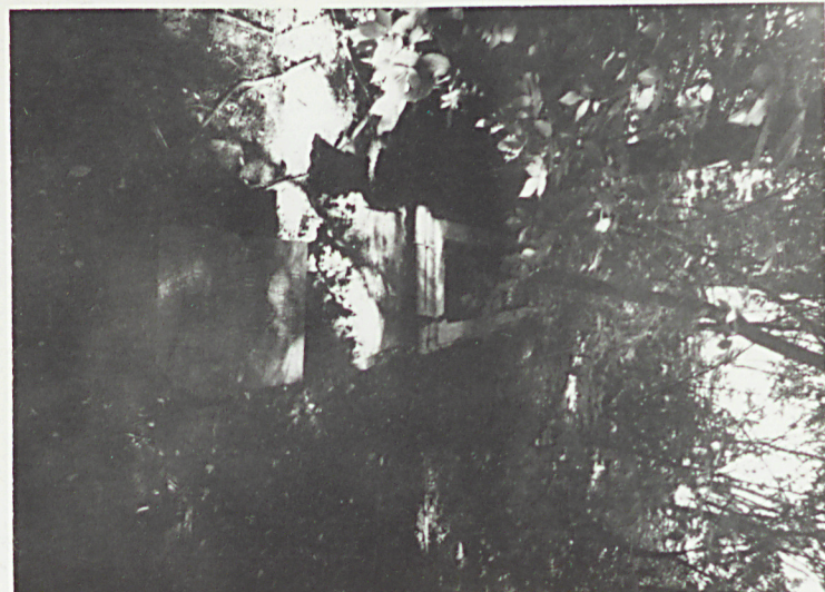
⑤ Tumba nagrobna -destrukt ok. 1918r.