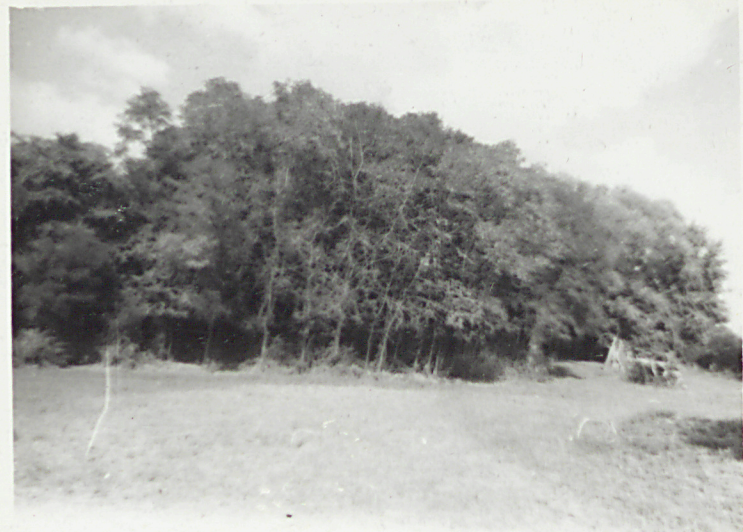
④ Widok ogólny, str. zachodnia