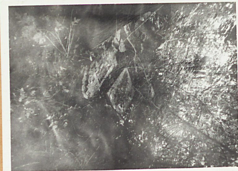
⑥ Destrukt nagrobny