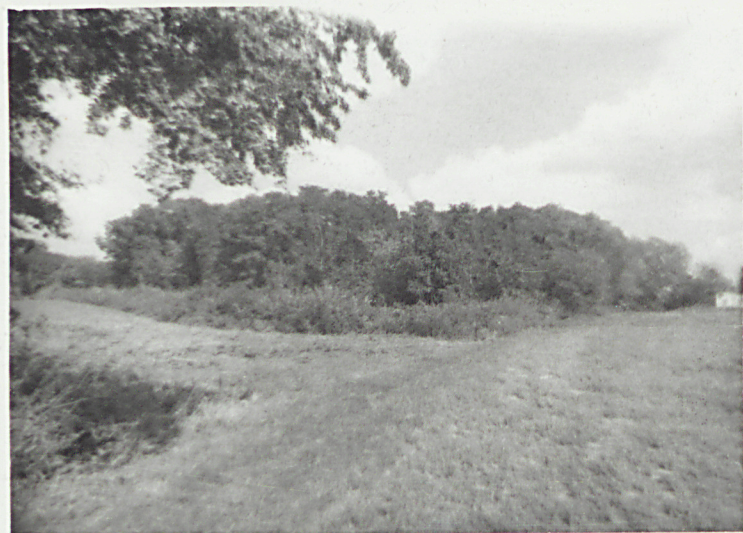
① Widok ogólny str. południowa