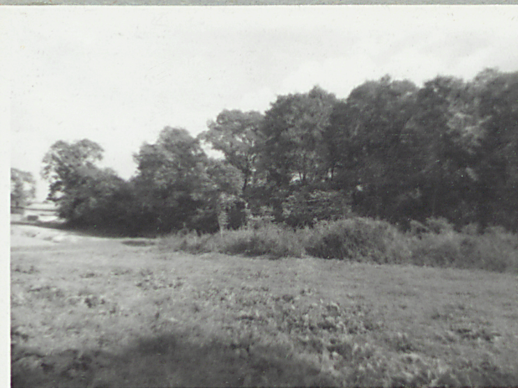
② Widok ogólny str. pn.