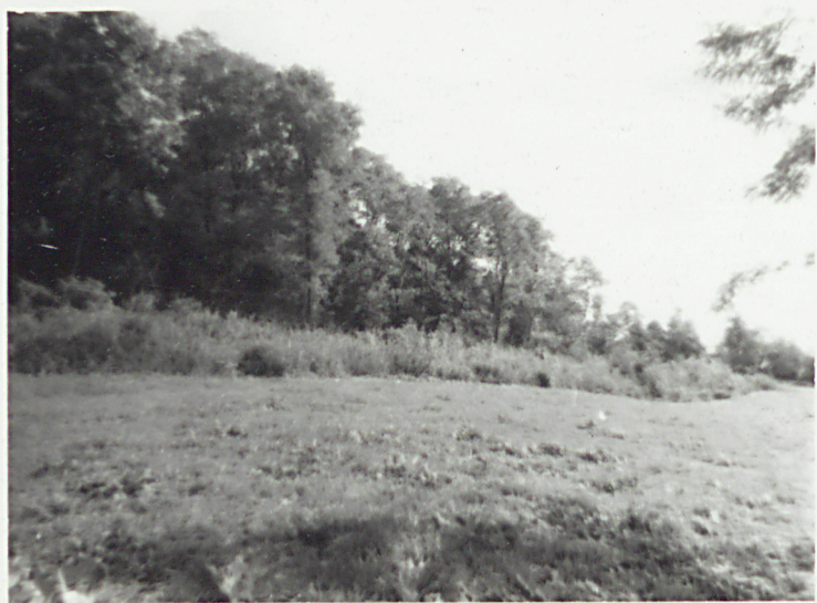
③ Widok ogólny str. połud-zach.