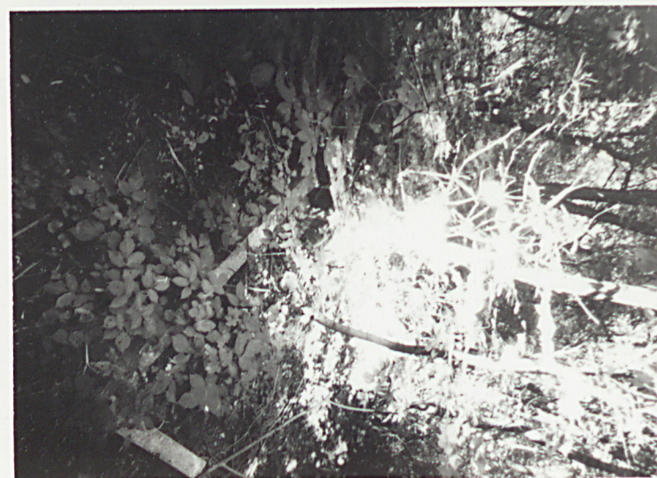
⑦ Pojedyncza mogiła z obramieniem