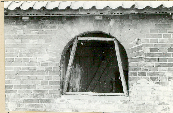
4. arkada podcienia