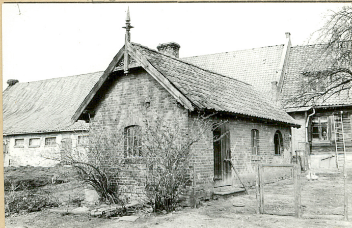
4. X widok od płd.-wsch.