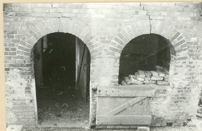
6. okno i drzwi od ptn.