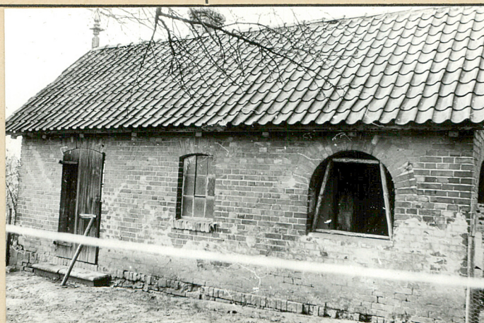
3. Widok od wsch.