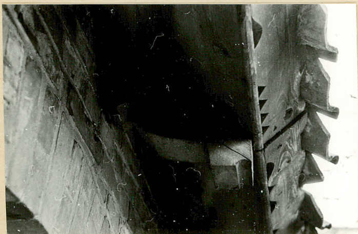
5. zacios krokwi