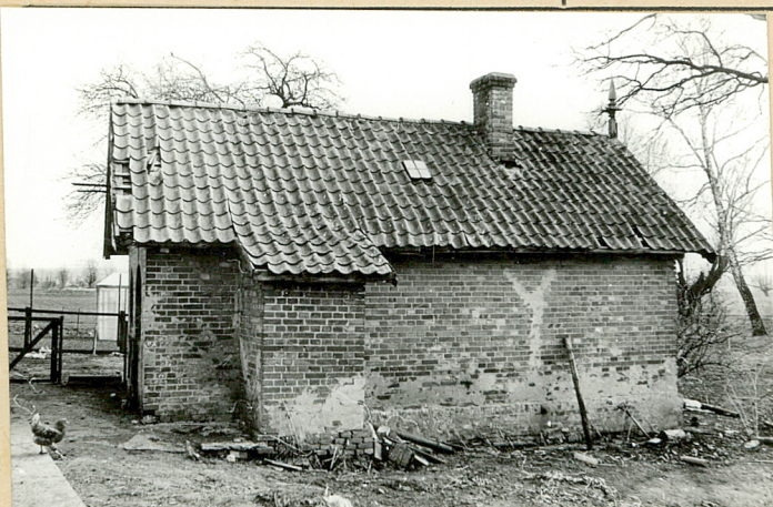
2. Widok od zach.