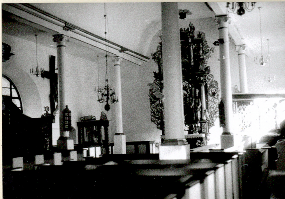
fol. 4. korpus nawowy fol. 5. korpus nawowy fol. 6. korpus nawowy

Wkładkę założył: Anna Groth - Kubicka 15 październik 1998 (imię, nazwisko, data)