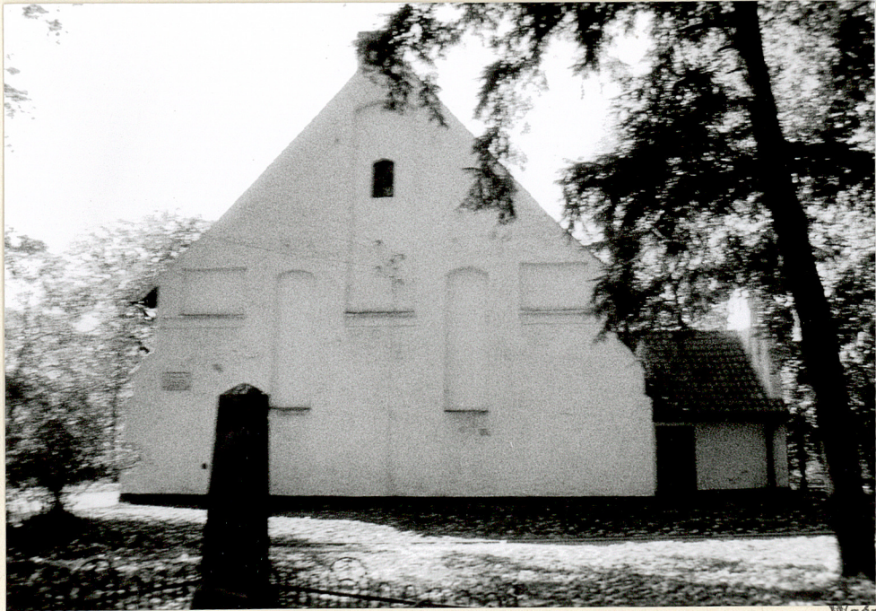
rys. 2. plan sytuacyjny fot. 4. widok elewacji wschodniej fot. 3. widok elewacji północnej fot. 2. widok elewacji południowo - wschodniej

Wkładkę założył: Anna Groth - Kubicka 15 październik 1998 r. (imię, nazwisko, data)