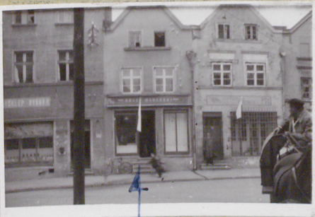
widok od ul. Dąbrowskiego