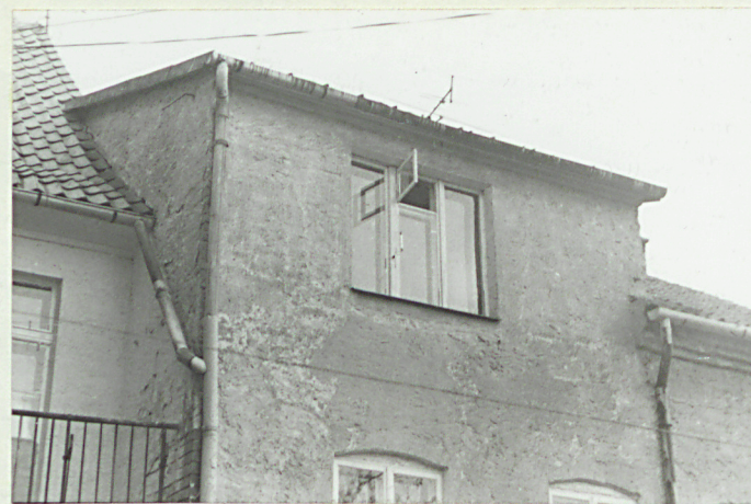
Podwyższona część elewacji tylnej.