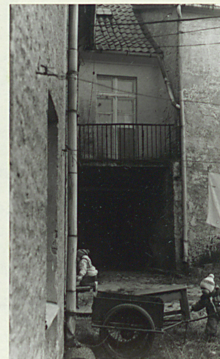
Połączenie domu z sąsiednim. Widoczny ślepy wjazd.

Wkładkę założył: Eliza Ptaszyńska, sierpień-wrzesień 1987 r. (imię, nazwisko, data)