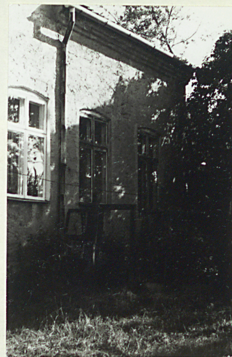
Pkd.część elewacji tylnej.