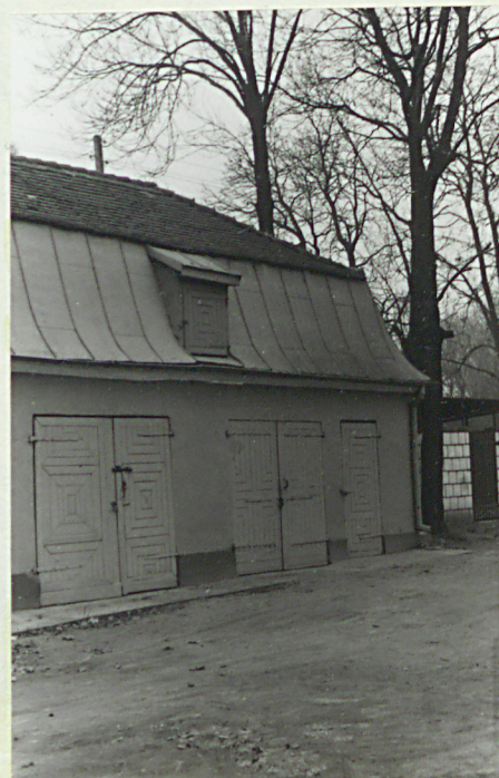
Wsch. część elewacji główniej.