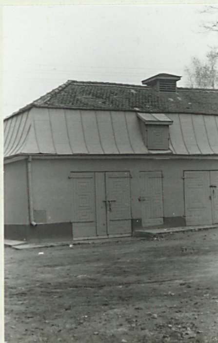
Zach część elewacji główniej.

3. Zawartość wkładki (nazwa obiektu lub materiału uzupełniającego) 4 zdjęcia.