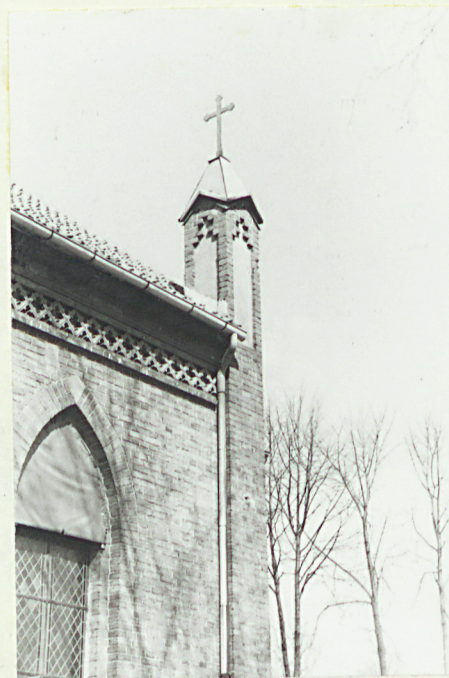
Płd-wsch naroże zwieńczone pinakiem