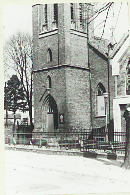
Portal i płd skrzyd- ło elewacji głównej