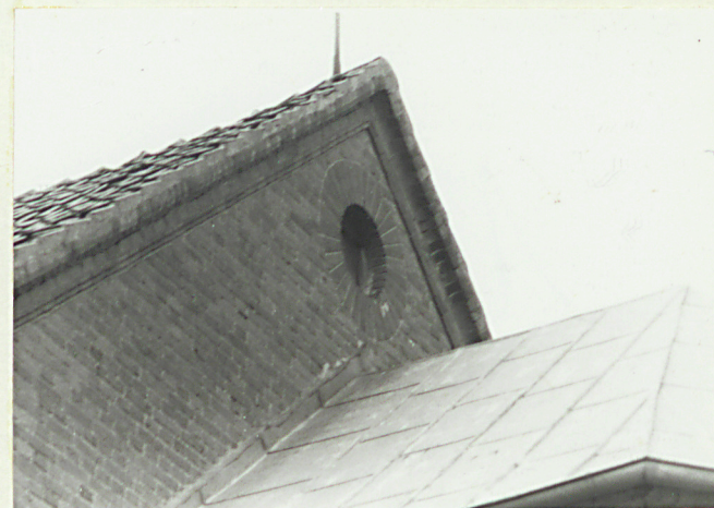
Okienko nad absydą