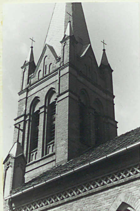
Górna partia wieży

3. Zawartość wkładki (nazwa obiektu lub materiału uzupełniającego) 8 zdjęć