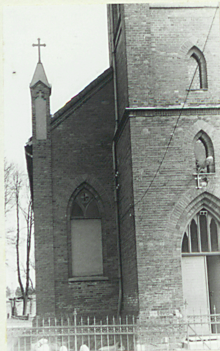
Płn skrzydło elewacji głównej