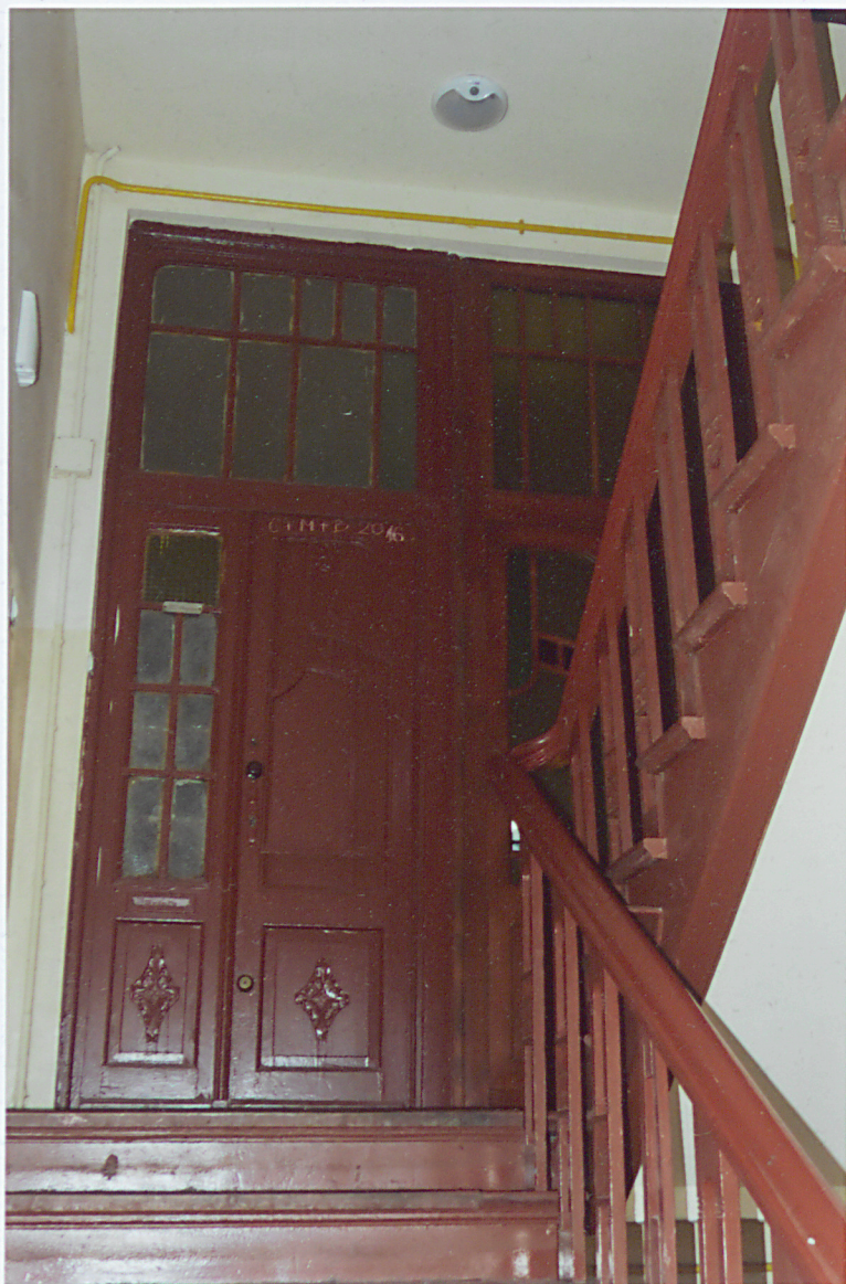
wnętrze klatki - drzwi do lokali