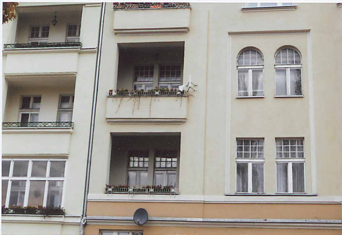
Fasada - artykulacja elewacji