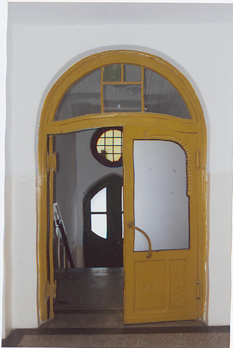
wnętrze klatki - drzwi wiatrołapu