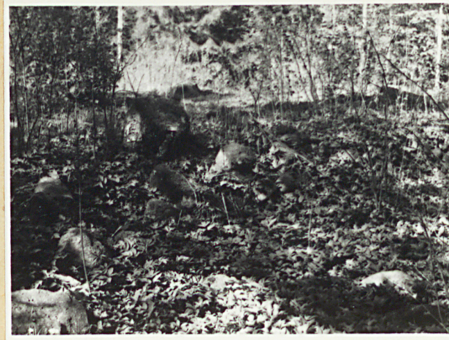
płd. granica cm.