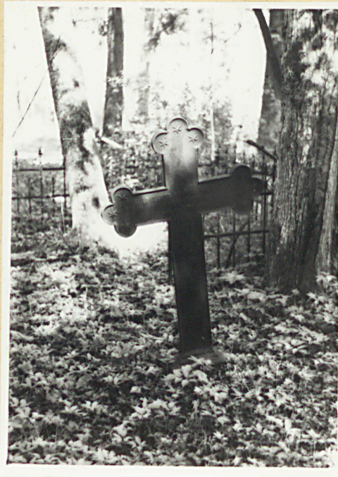
żeliwny krzyż nagr.