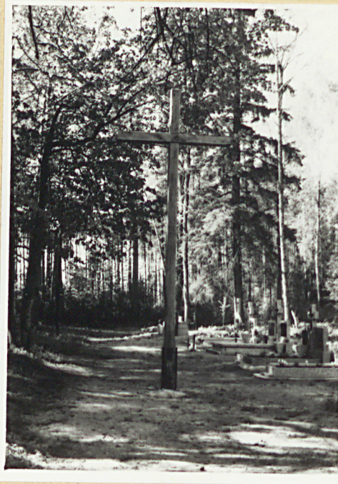
krzyż drewn. współcz.