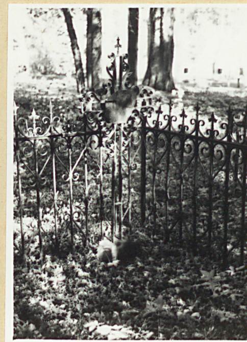
frag. ogr. kwatery