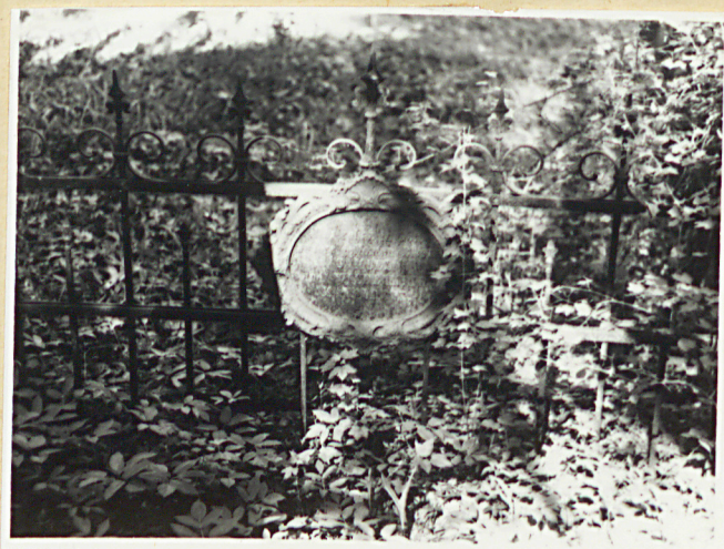
fragm. ogrodz. kwatery