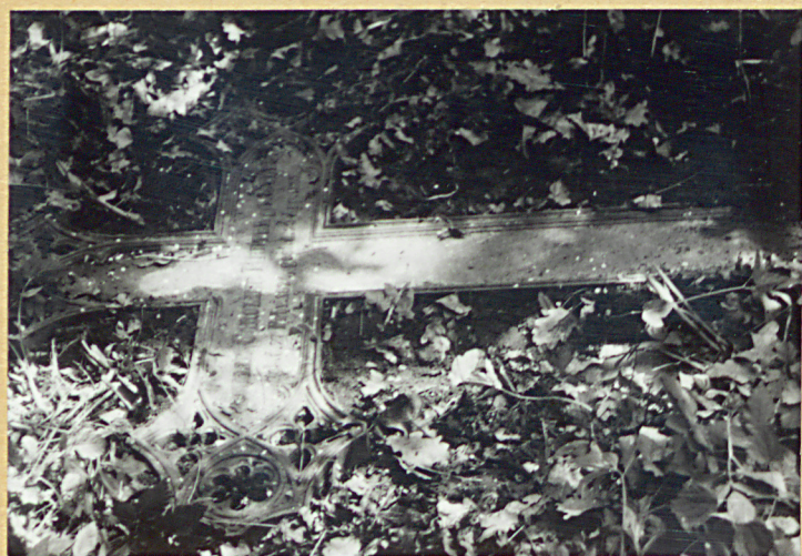
Krzyż z 1885 r.