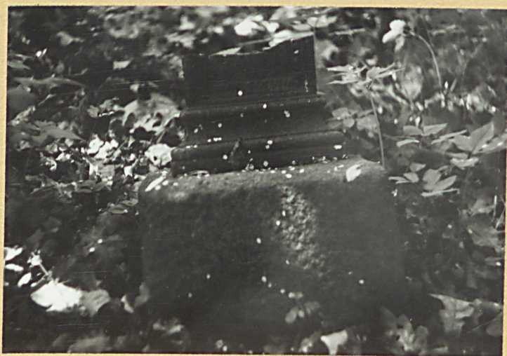
Postument krzyża z 1885 r.