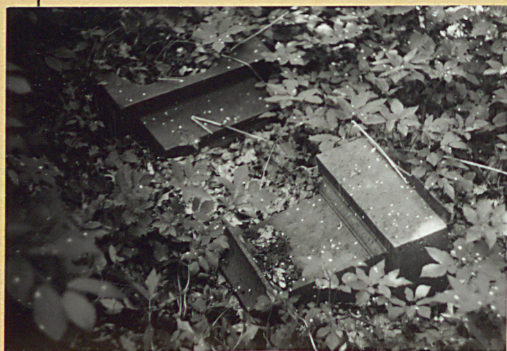
Elementy zniszczonego nagrobka