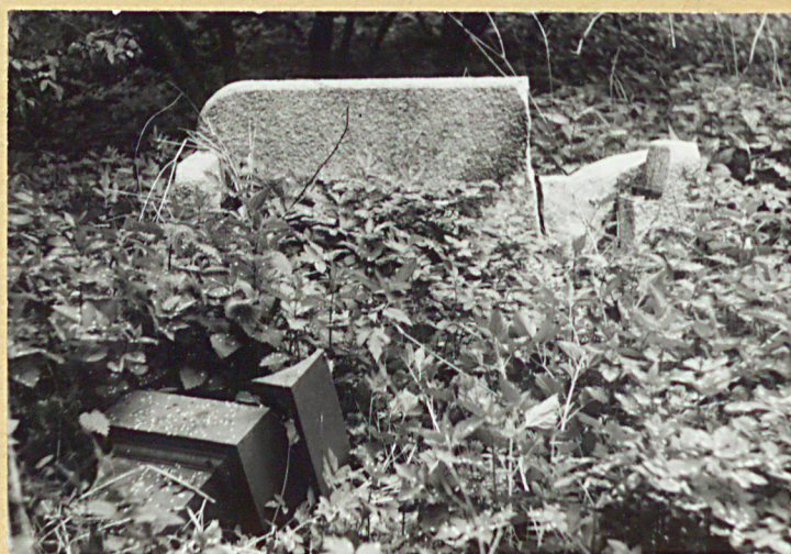
Ławka kamienna i element nagr.