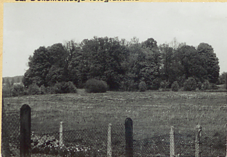
Widok na park od wschodu