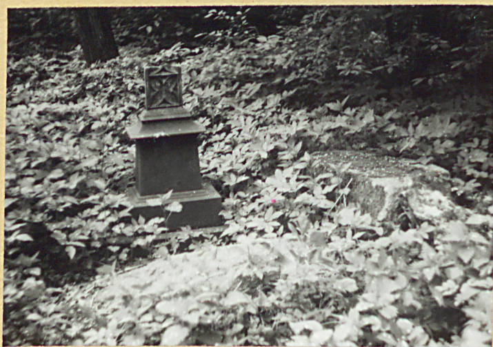
Zachowany postument krzyża