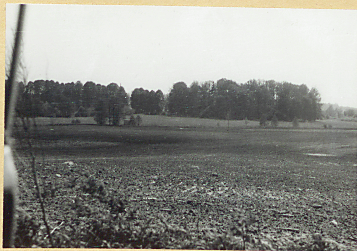
Widok na park od pñ.- zachodu