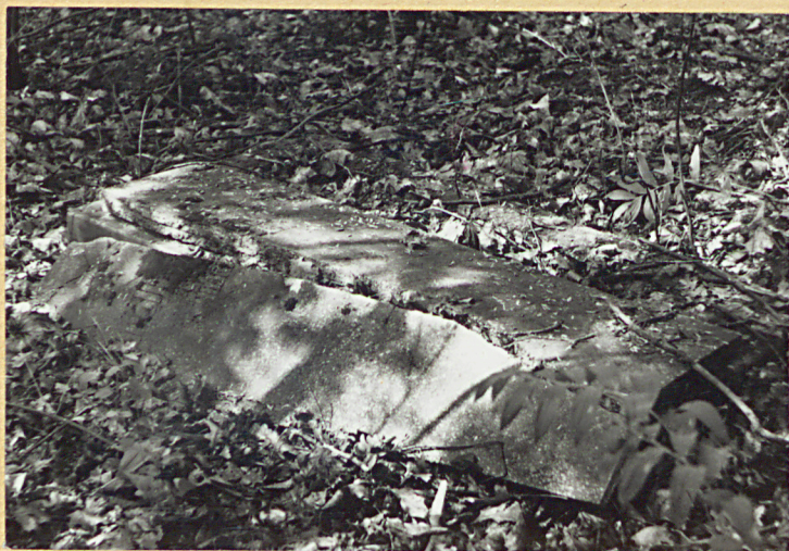
Nagrobek z 1895 r.