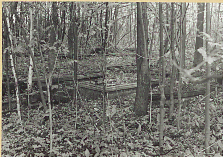
Fragment cmentarza w jego płu. - wschodniej części