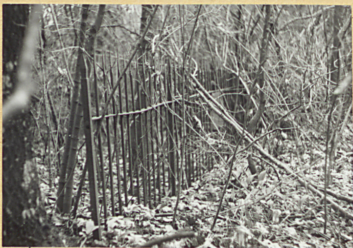
Metalowe ogrodzenie kwatery rodzinnej