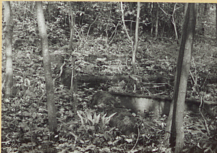
Zachowane nagrobki w południowej części cmentarza