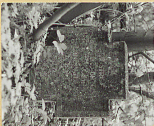
Grób żołn. niem. - 1918 r.