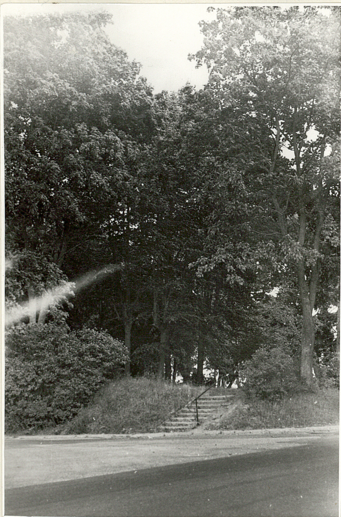
WIDOK OGÓLNY CMENTARZA