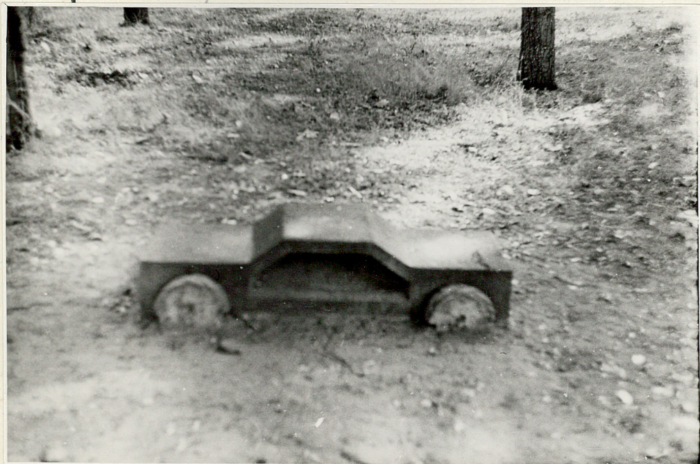
FRAGMENT PŁYTY KAMIENNEJ