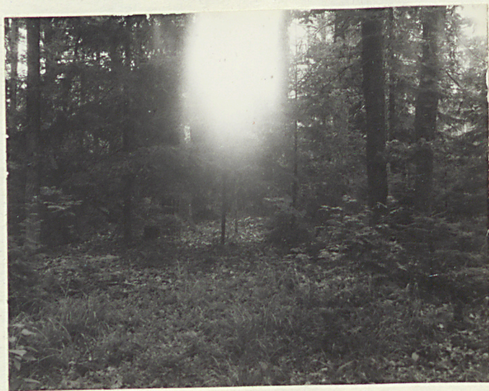
fot.1 - miejsce lokalizacji mogiły z 1914r,