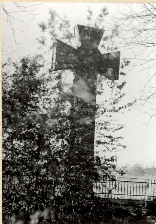
Krzyż betonowy z okolicz- nościowym napisem; napis trudny do odczytania, informuje m.in., że spoczy- wa tu 139 żołnierzy niemiec- kich, poległych w czasie I wojny św.