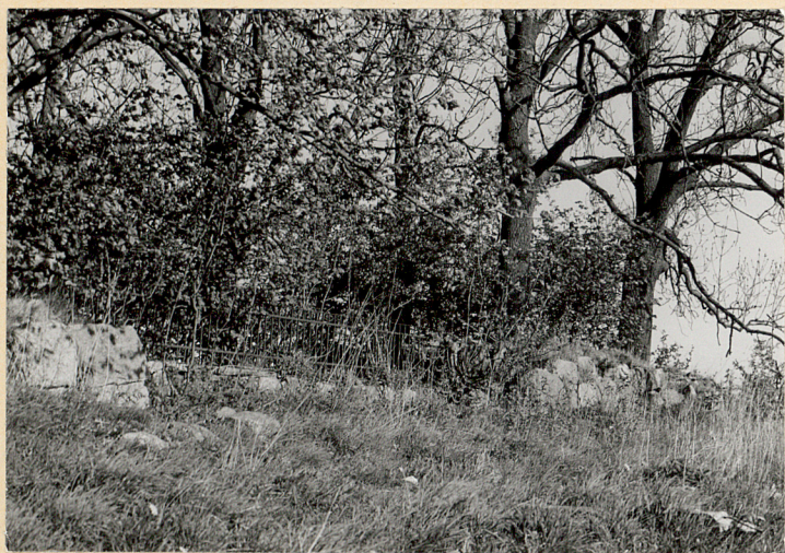
Fragment ogrodzenia ( mur i parkan z prętów metalowych