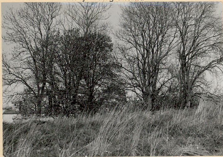
Widok z połudn.- zachodu