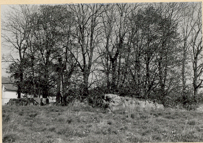
Widok z połudn.- wschodu