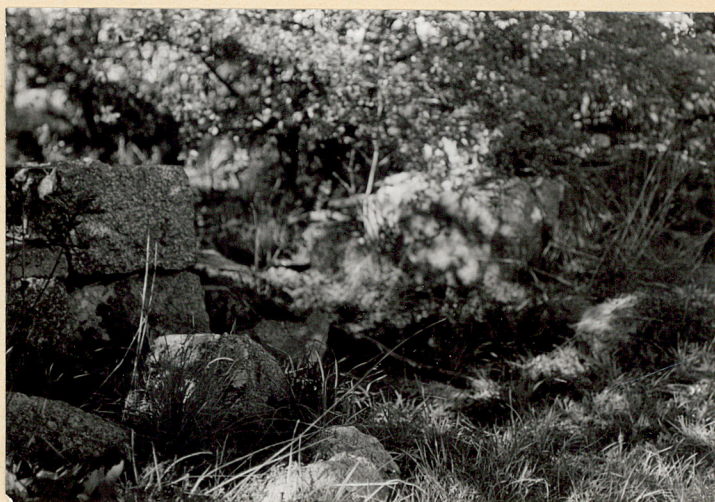
Zniszczony mur w pobliżu bramy