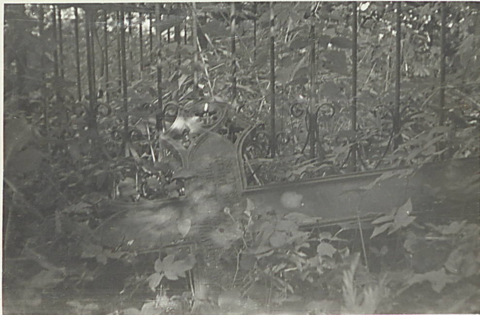
krzyż mogiły z 1894 r. i ogrodzenie grobowca