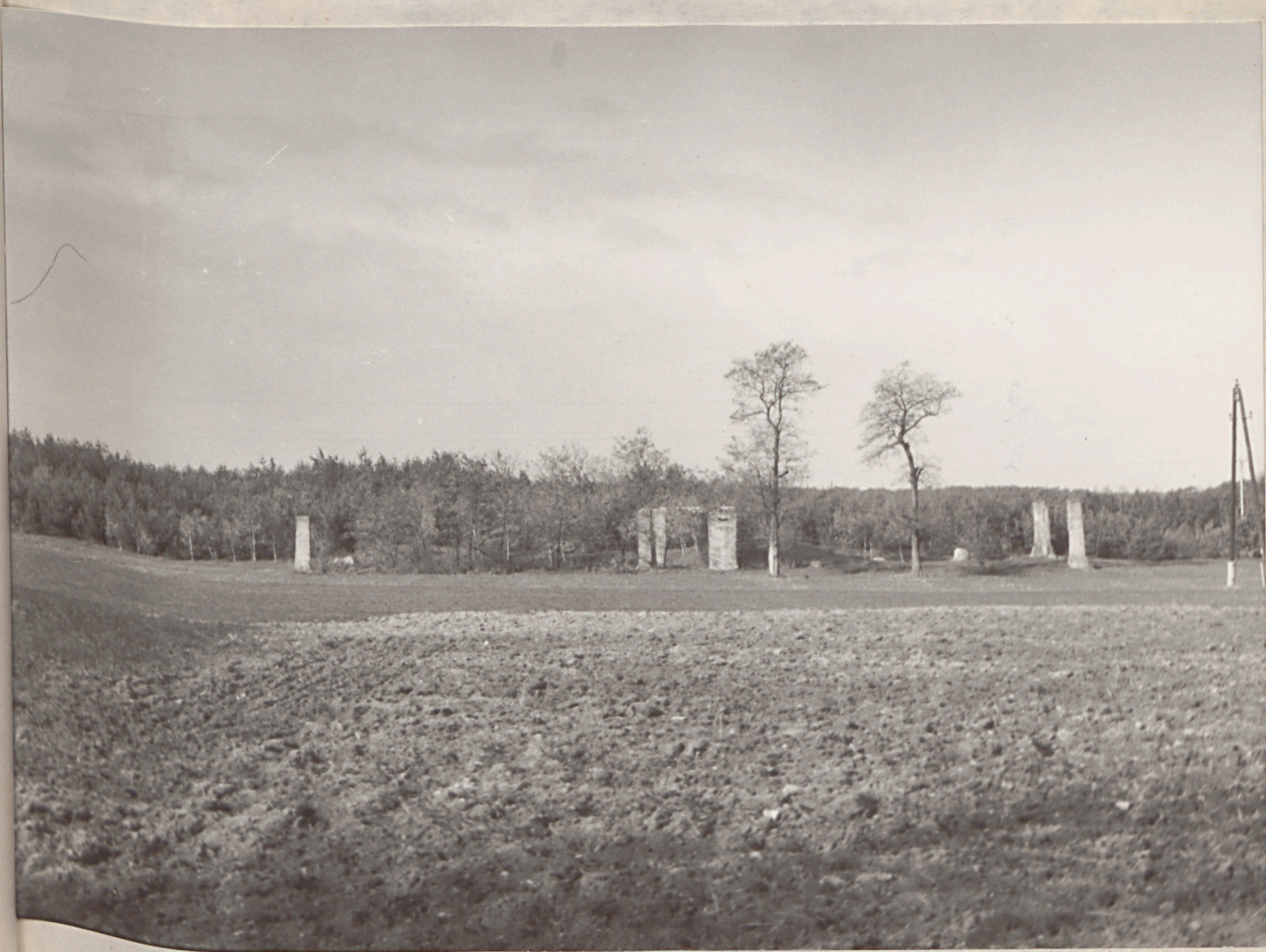
Fot. 5.- ruiny budynków podworskich - widok w kierunku zachodnim