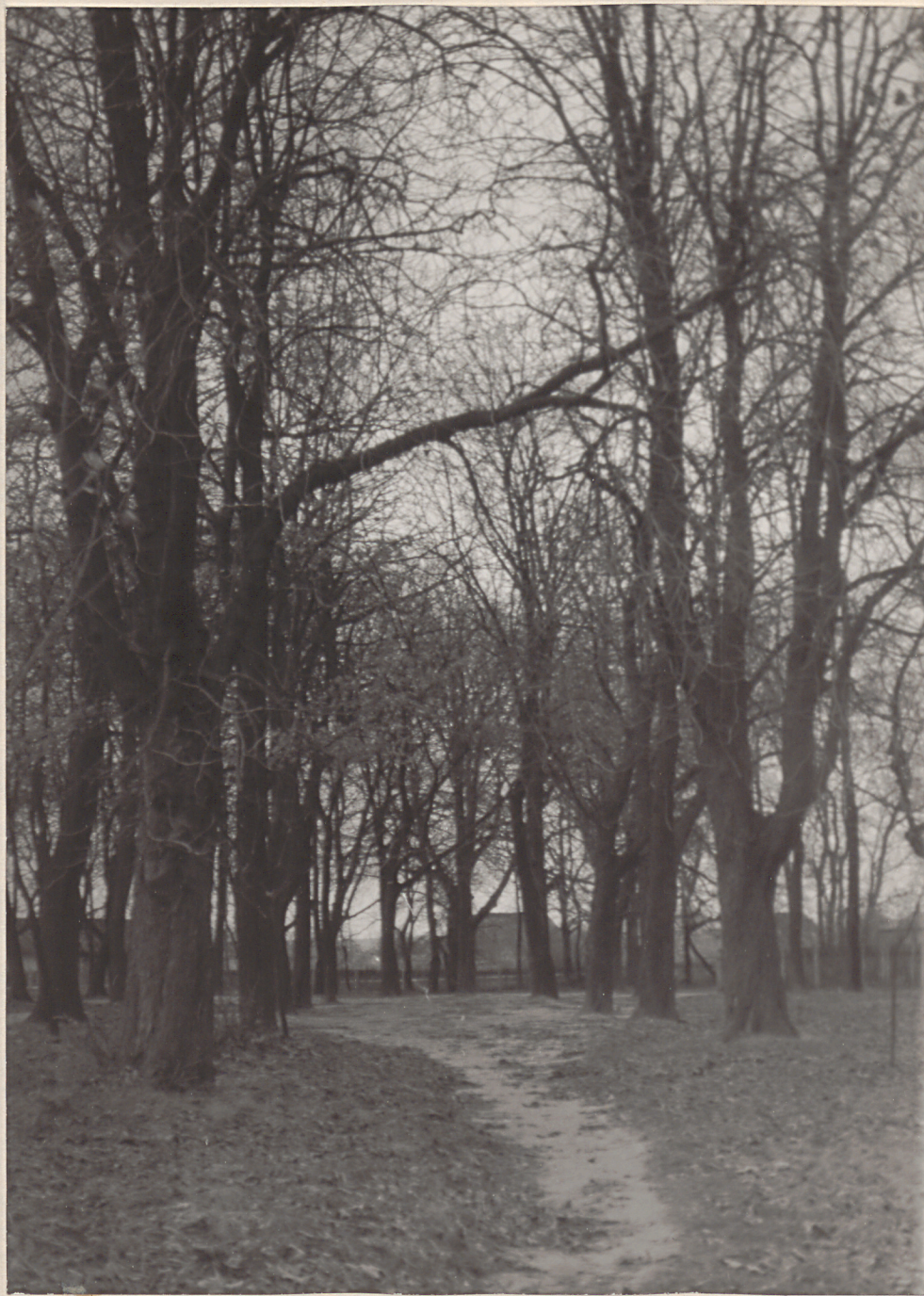
Fot.2. - fragment alei ksztanowej - widok od strony północno wschodniej