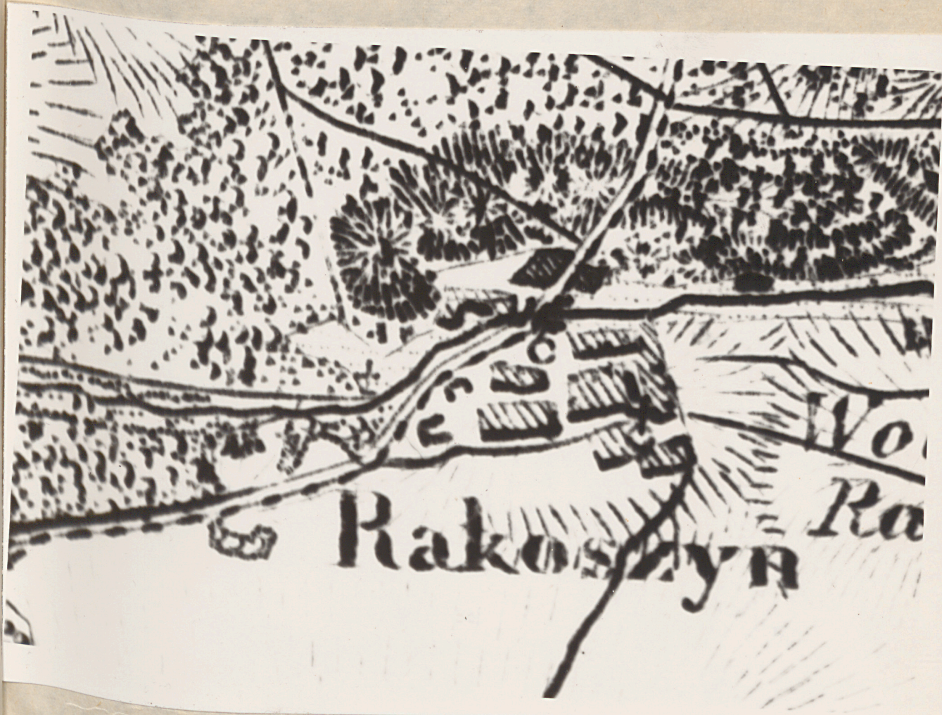
RAKOSZYN - Fragment Topograficznej Karty Królestwa Polskiego. - 1839 r.