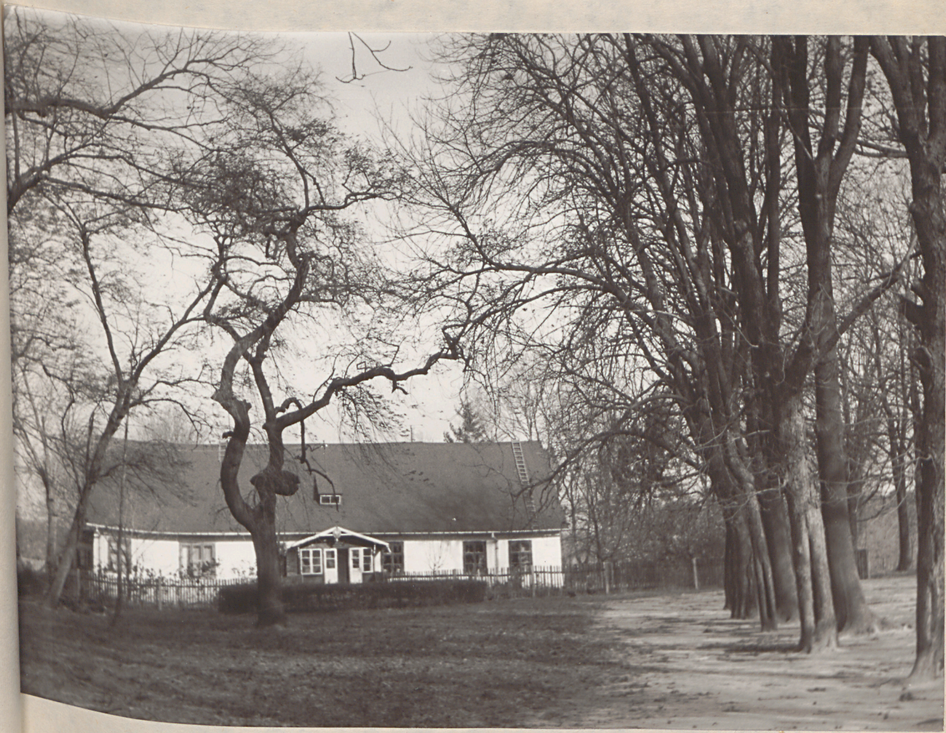
Fot.1. - budynek podworski - widok od strony wjazdu