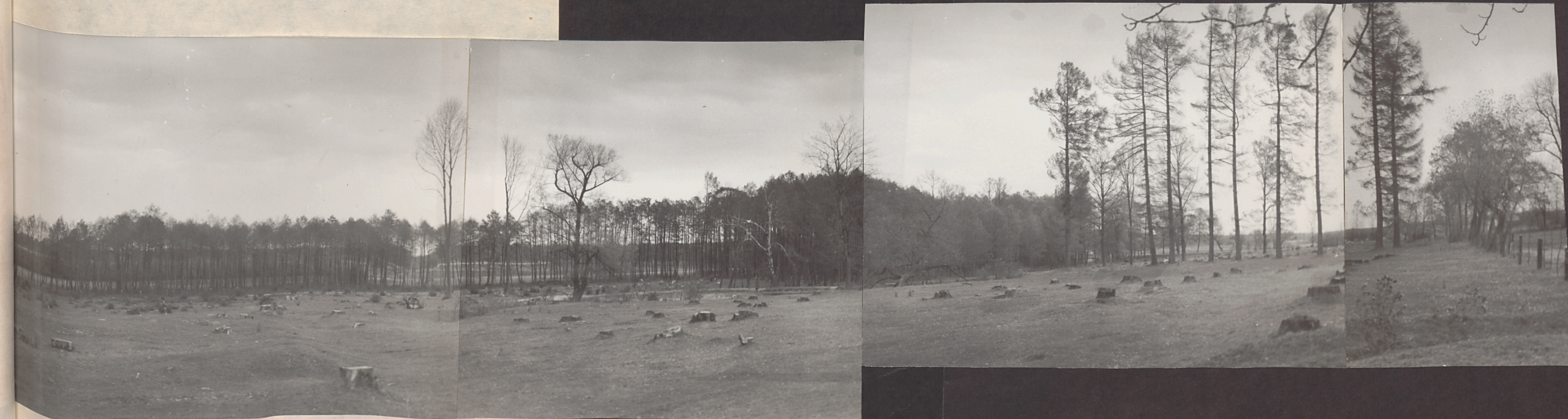
Fot.4. - panorama zniszczonej północnej części parku