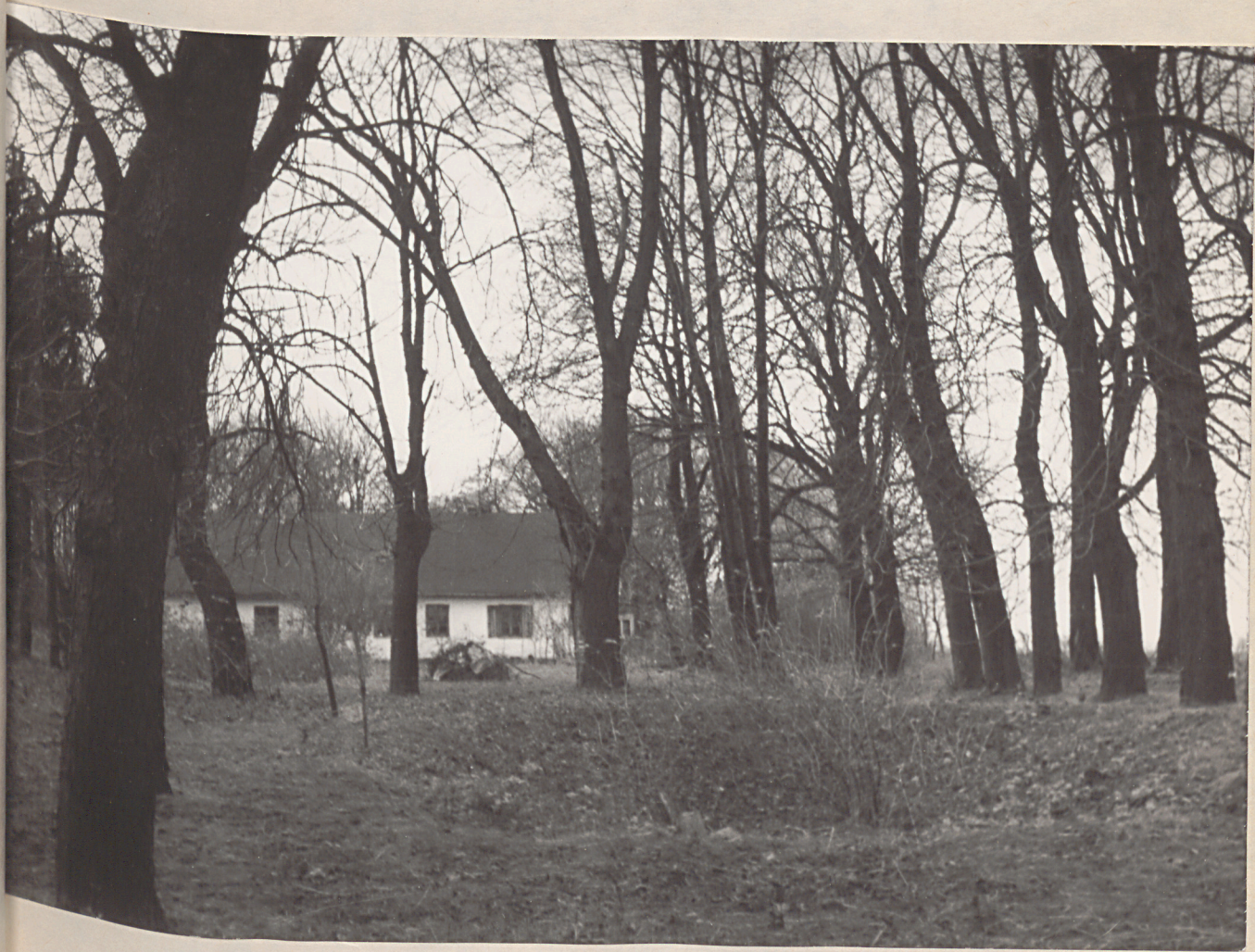
Fot.3. - fragment alei kasztanowej za budynkiem w części północnej parku