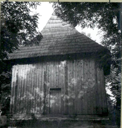
SYTUACJA, ZDJĘCIA: PLAN-886

36. Wypełnił dnia VII. 1959 PODPIS NIECZYTELNY 37. Sprawdził dnia VIII. 1967 Poprawił Przeisał 886Tubien