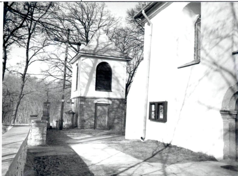
Widok dzwonnicy od wsch.