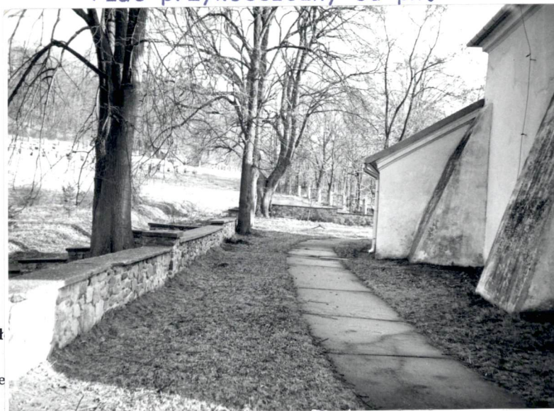
Plac przykościelny od pn.