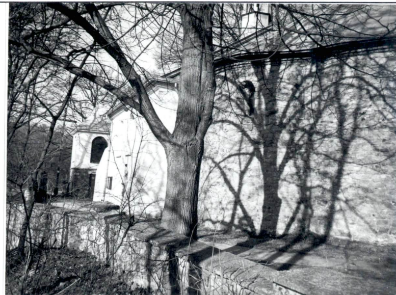
Widok kościoła od pd.