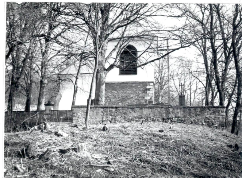
Dzwonnica od zach.