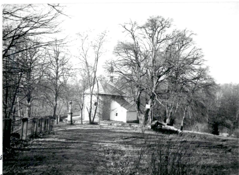
Widok od pn.-wsch.