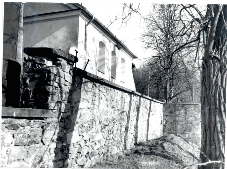
Mur ogrodzenia od pd.-zach.