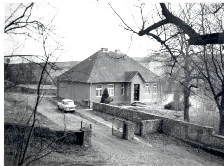
Widok na plebanię.