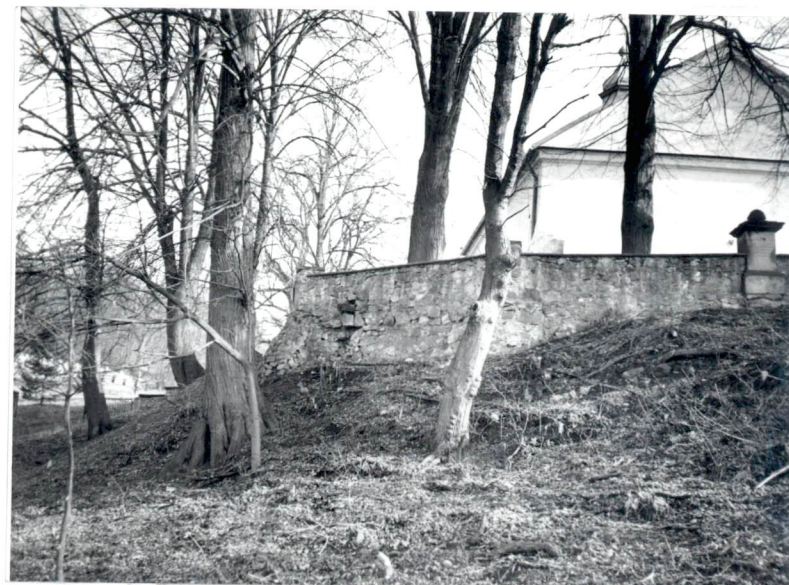
Mur - od pn.-zach.