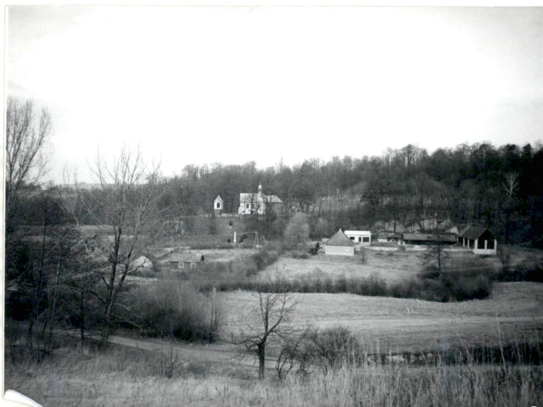
Widok zespołu od pd.