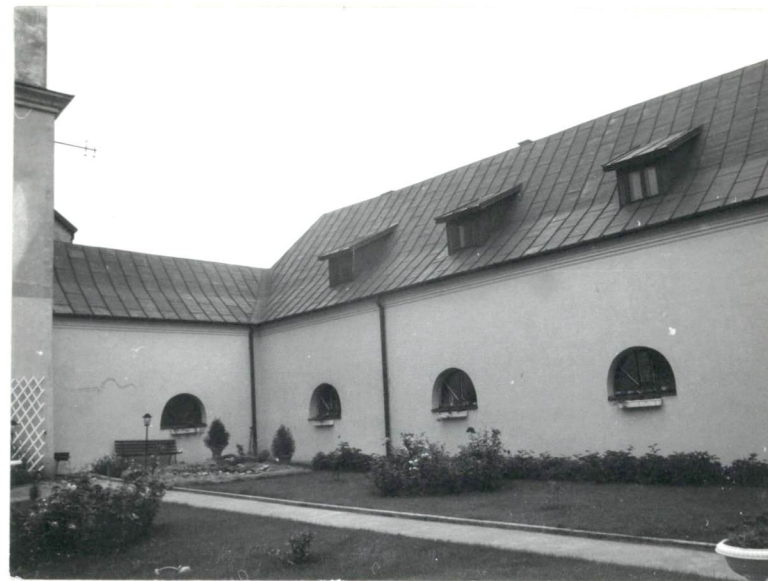
Elewacja południowa skrzydła północnego z lewej- fragment wieży i elewacji wschodniej skrzydła zachodniego.