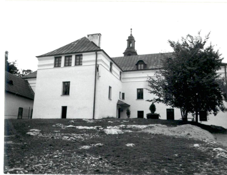
Elewacja wschodnia w cz. północnej, od pld . . . budynek d. kuchni.

Wkładkę założył: ..... (imię, nazwisko, data)