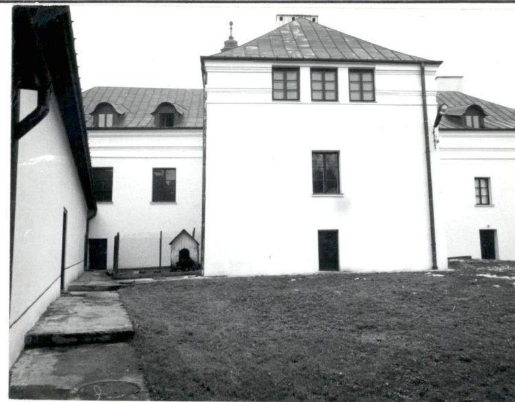
Elewacja wschodnia w centrum budynek d. kuchni.