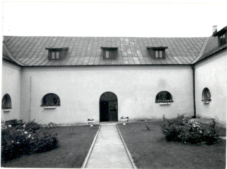
Elewacja zachodnia od strony wirydarza - skrzydło wschodnie.