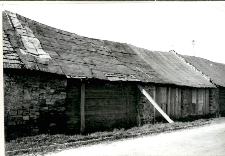
SEGMENT 3-ci od WSCH.