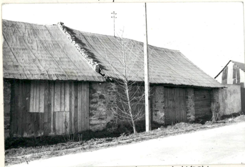
SEGMENT 4-ty od WSCH.