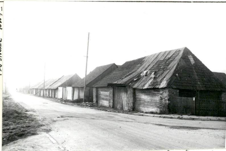
SKRAJNY WSCH. SEGMENT ku ZACH. (po str. PN.) →