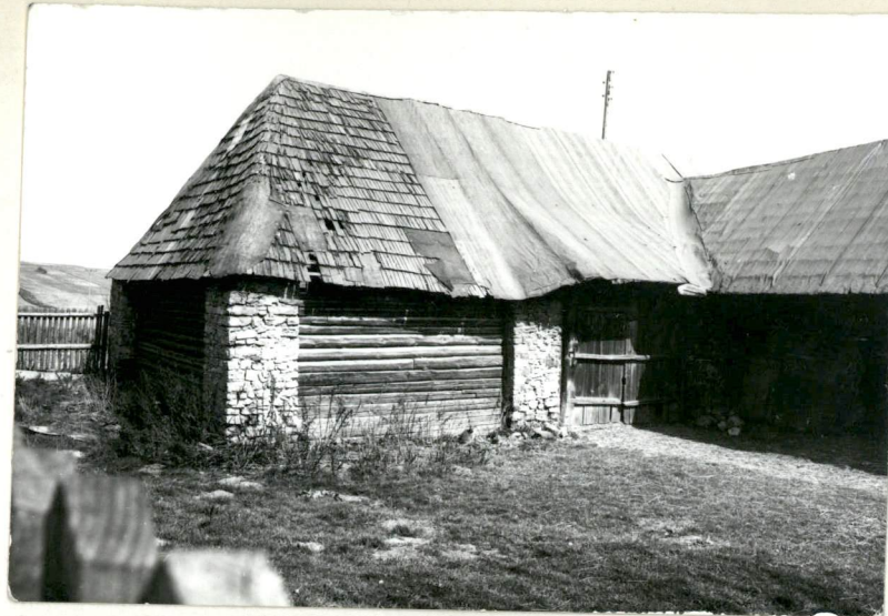
WIDOK OD PD.-ZACH. K. PD.