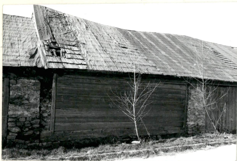
FRAGMENT 2-go od WSCH SEGMENTU