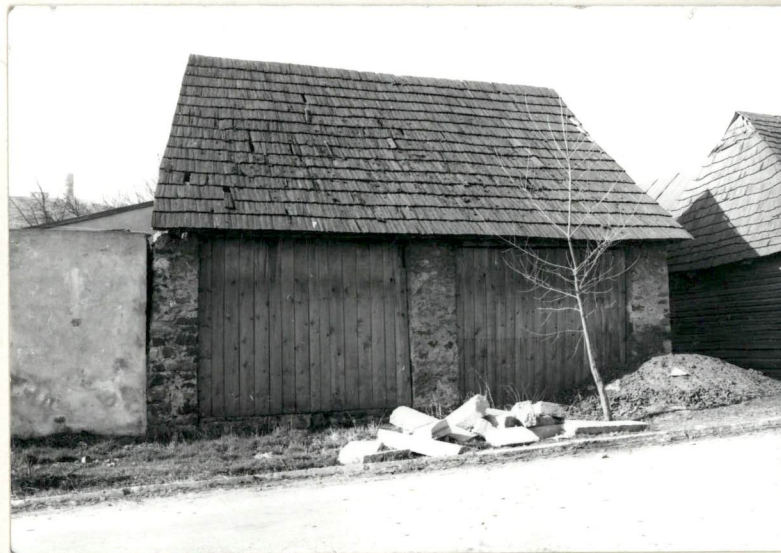
SEGMENT 5-ty od WSCH