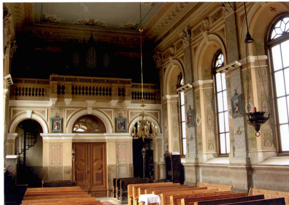
Widok na chóór muzyczny