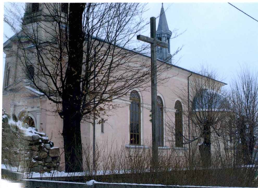
Widok od strony PŁD-ZACH