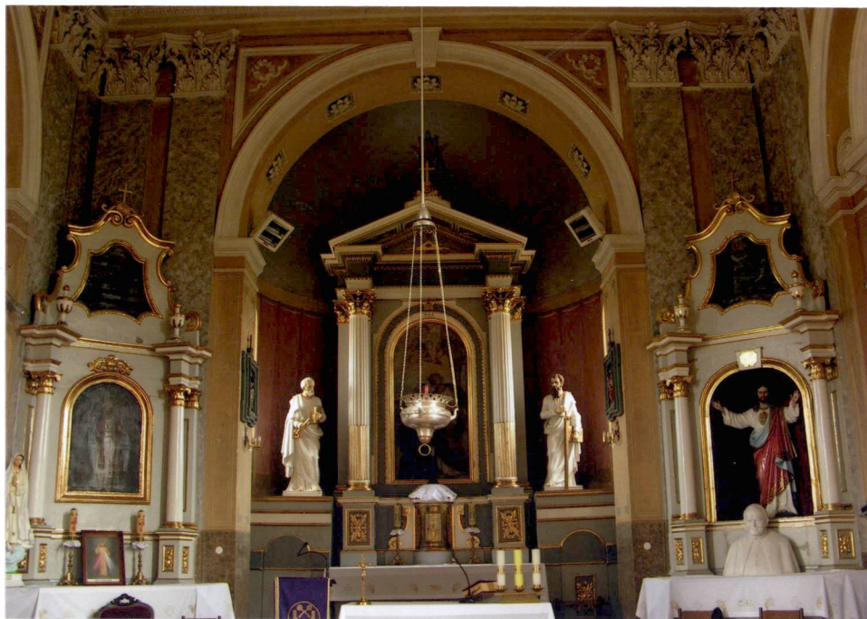
Widok na prezbiterium