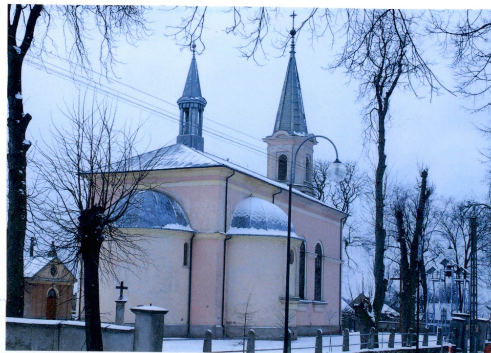
Widok od strony PŁN-WSCH