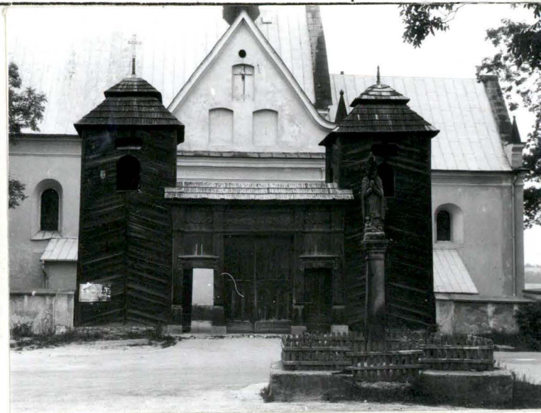
Widok dzwonnicy i bramy od pd.