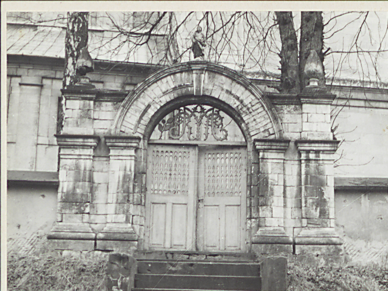
neg. A 38243, 38244