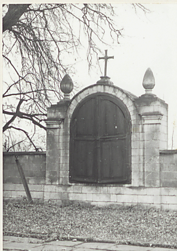
neg. A 38244