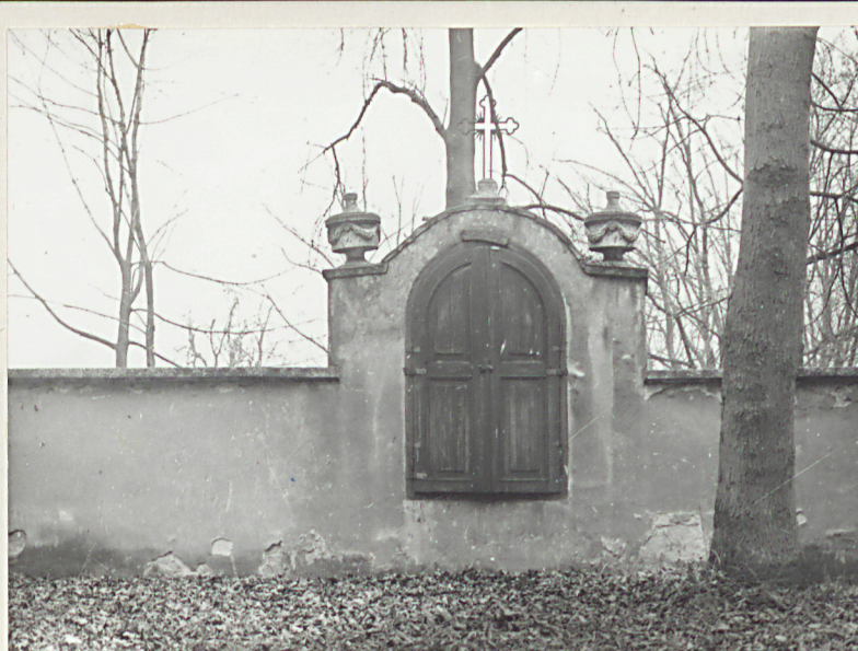
neg. A 38245