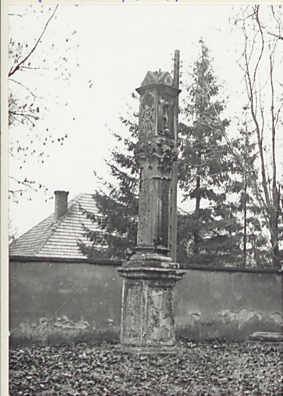
neg. A 38245