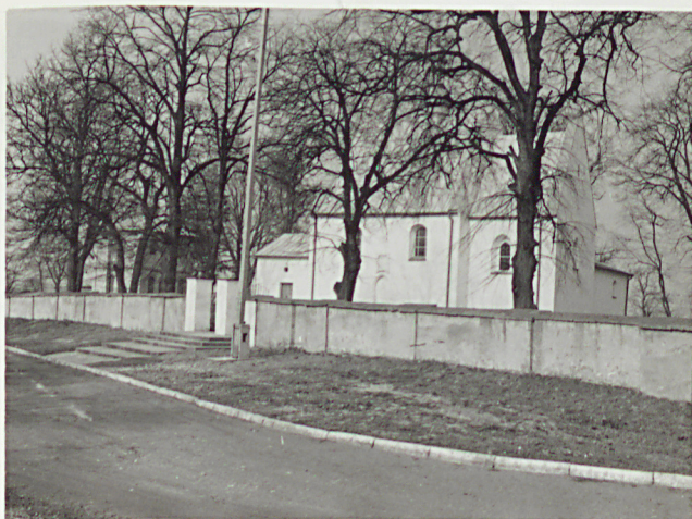
6. WIDOK NA CMENTARZ OD PD.-NSCH.