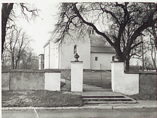
5. BRAMA GŁÓWNA OD NSCH.