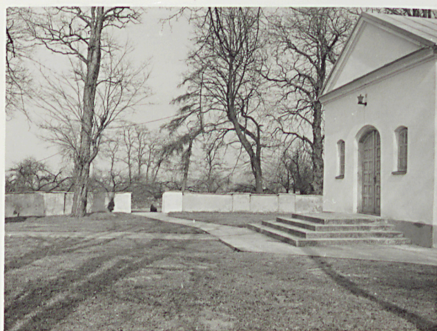
3. WIDOK CMENTARZA Z PD. NA PN.