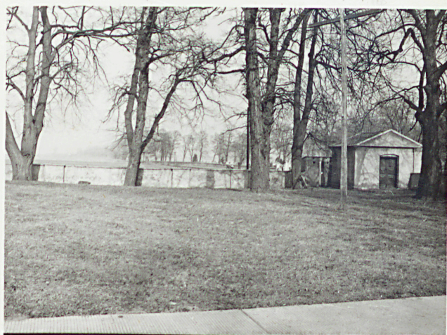
2. WIDOK W STRONĘ KOSTNICY OD PD.