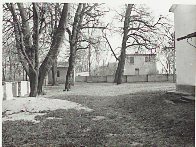
4. WIDOK W STRONĘ KOSTNICY OD ZACH.