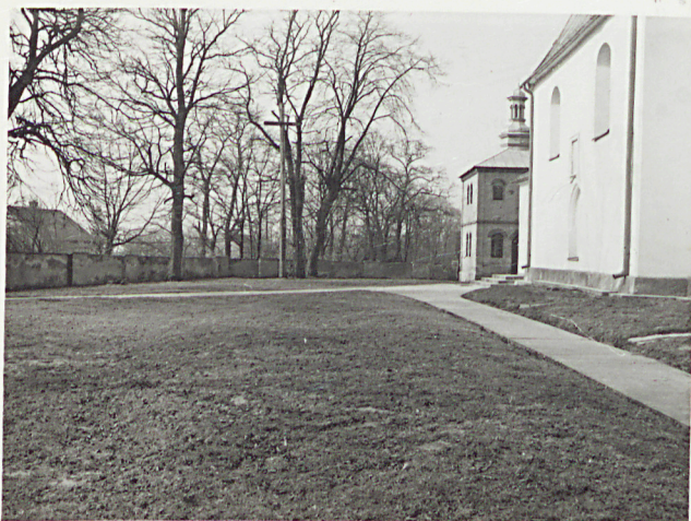
1. WIDOK W STRONĘ DZWONNICY OD NSCH.