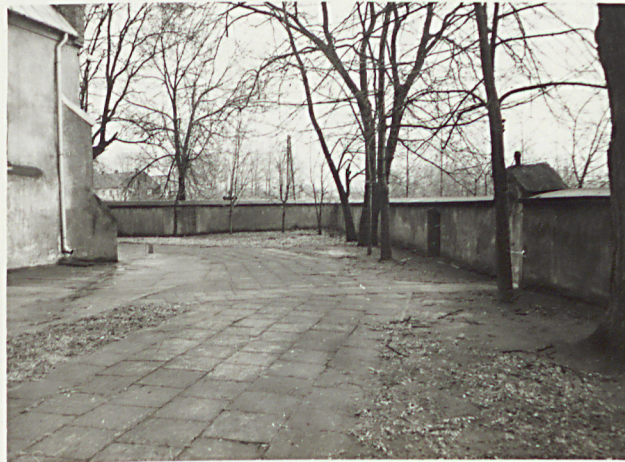
4. WIDOK CMENTARZA W KIERUNKU WSCH.