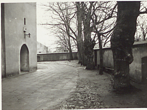
3. WIDOK CMENTARZA W KIERUNKU PD.