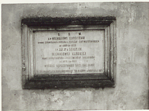
7. EPITAFIUM MICHAŁA KARSKIEGO I JULII KARSKIEJ