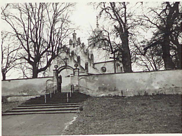
1. WIDOK W KIERUNKU BRAMY GŁÓWNEJ