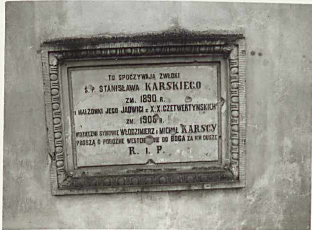
8. NAGROBEK STANISŁAWA I JADWIGI KARSKICH