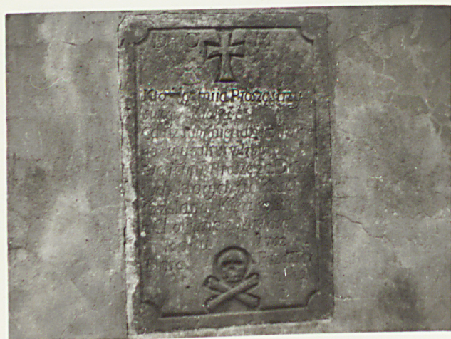
5. TABLICA WSPÓLNEGO POGRZEBANIA KOŚCI