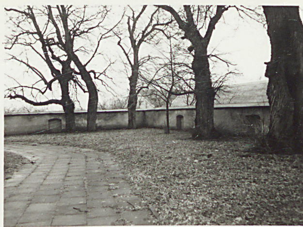
2. WIDOK CMENTARZA W KIERUNKU ZACH.