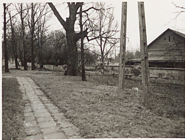
3. WIDOK CMENTARZA W KIERUNKU PD - ZACH.