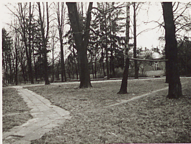
4. WIDOK CMENTARZA W KIERUNKU PD - WSCH.