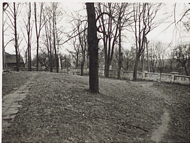
2. WIDOK CMENTARZA W KIERUNKU PN - ZACH.