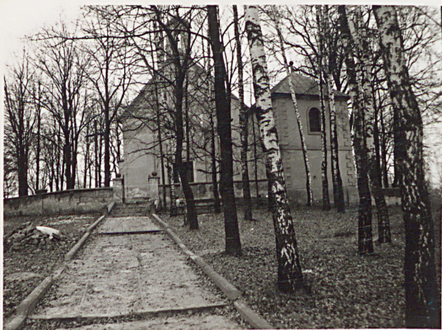
1. WIDOK W KIERUNKU BRAMY GŁÓWNEJ