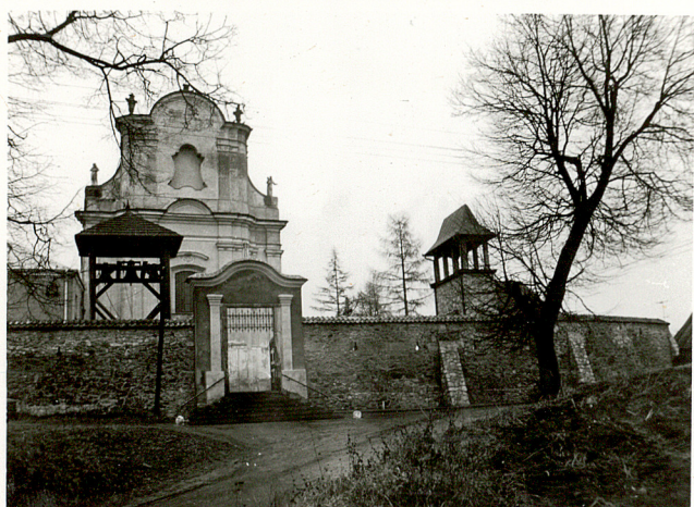
1. WIDOK NA CMENTARZ OD PD - WSCH.