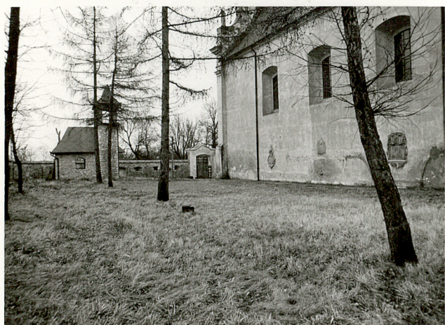
3. WIDOK CMENTARZA W KIERUNKU PD.