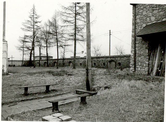
2. WIDOK CMENTARZA W KIERUNKU PN.