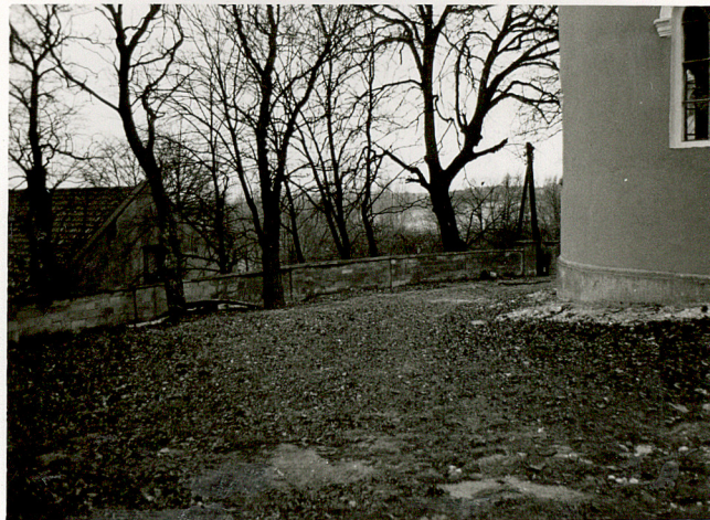
4. WIDOK CMENTARZA W KIERUNKU PD - ZACH.