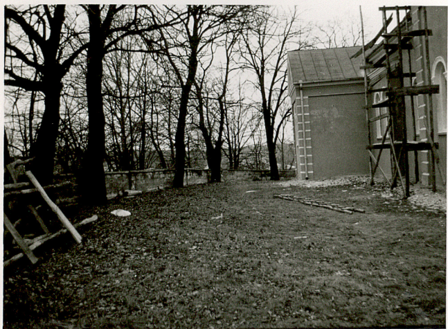
3. WIDOK CMENTARZA W KIERUNKU PD - WSCH.