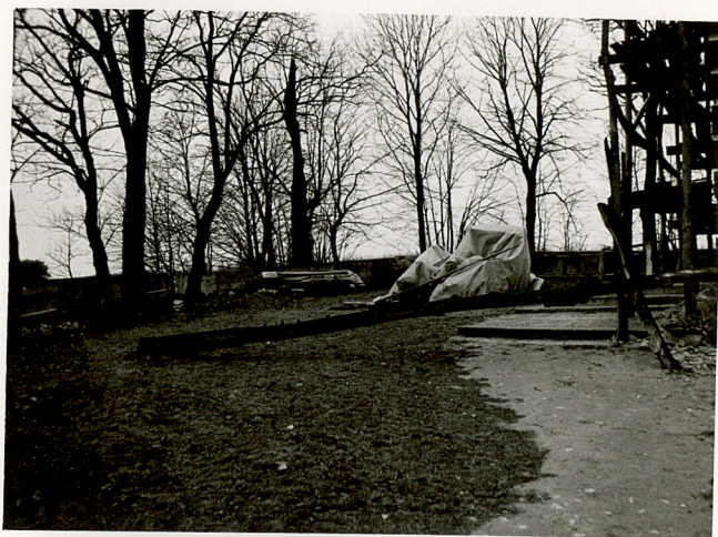
2. WIDOK CMENTARZA W KIERUNKU PN - WSCH.