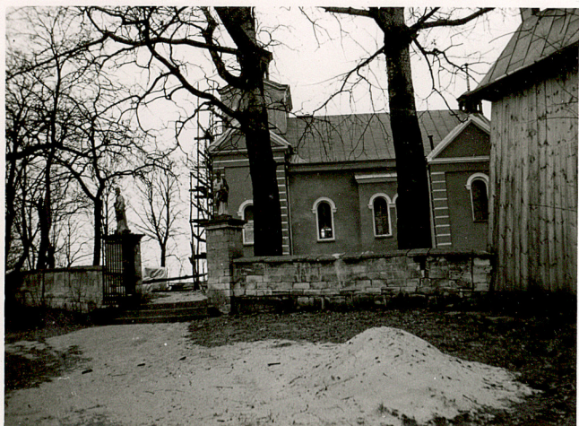
1. BRAMA GŁÓWNA