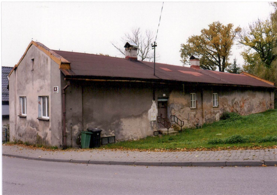
Widok elewacji południowa i wschodnia od ulicy Kotulińskiego.