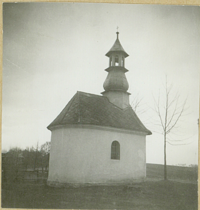
Wzór jednoraz. — CWD, W-wa, Bielańska 18, zam. Nr 2161/S2/III