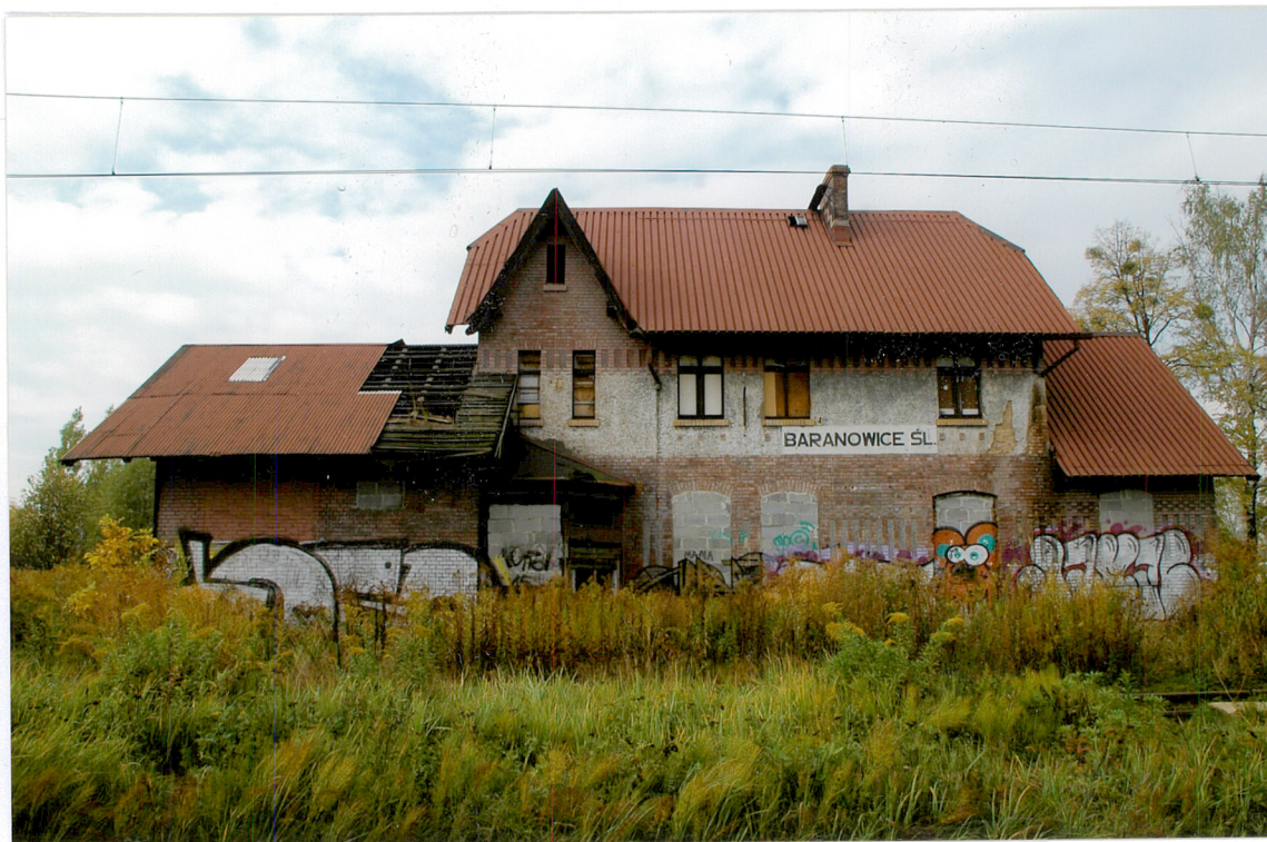
Budynek, widok od strony zachodniej