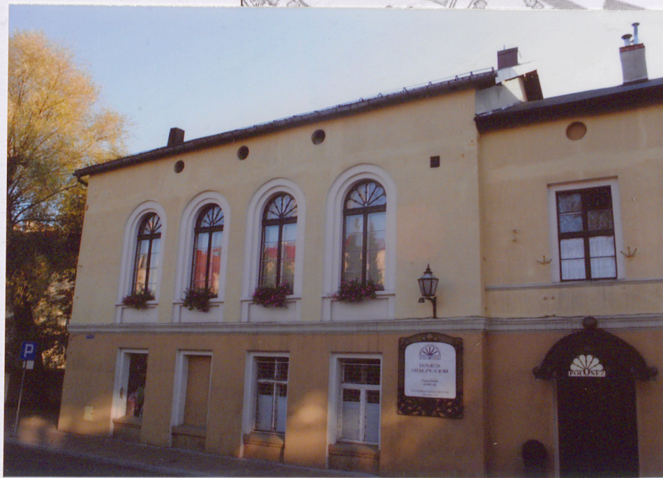
Fot. 01 - Główna Elewacja