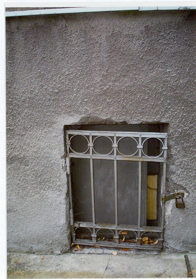
Fot. 12. Krata okienka piwnicznego