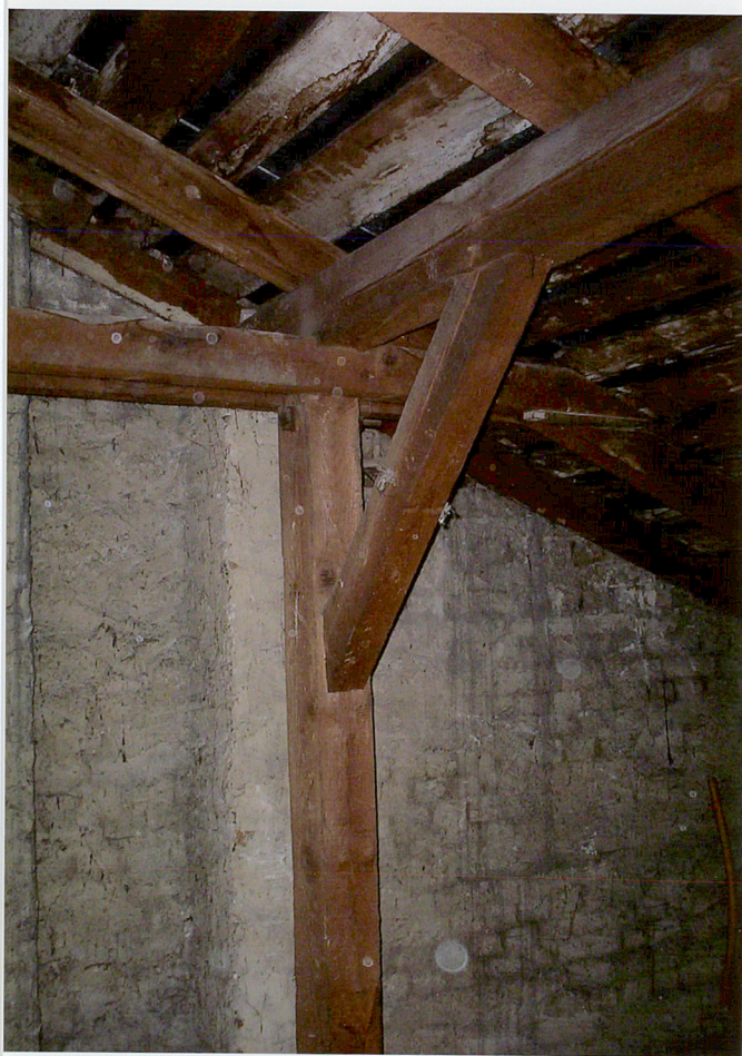
Fot. 27. Ściana szczytowa strychu z fragmentem więźby dachowej