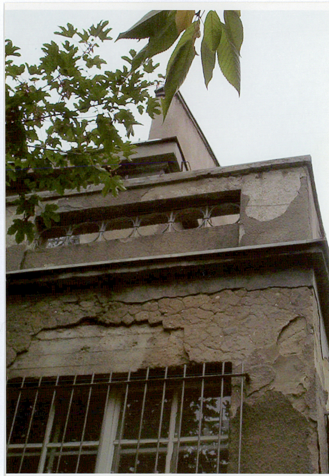
Fot. 8. Weranda, detal