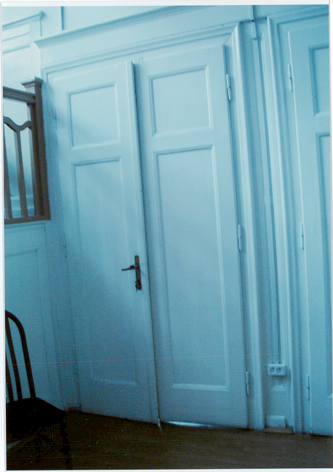
Fot. 22. Drzwi wewnętrzne drewniane