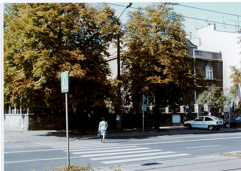
Fot. 3. Naroże wschodnio-południowe budynku (widok z ulicy Alei Wolności)