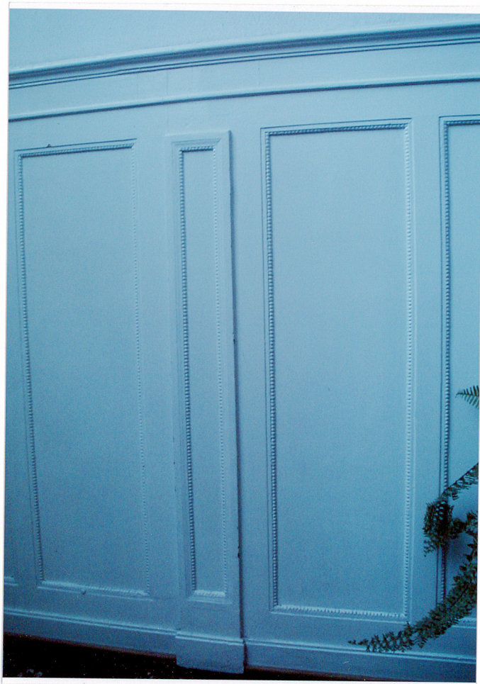
Fot. 19. Boazeria w holu na parterze