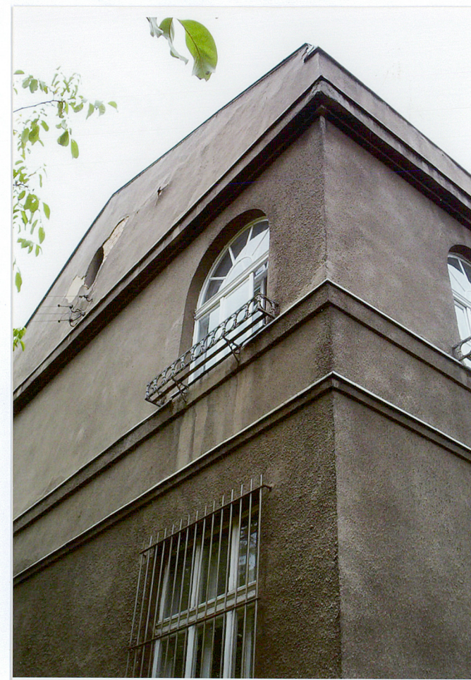
Fot. 4. Szczyt dachu naroża jak obok