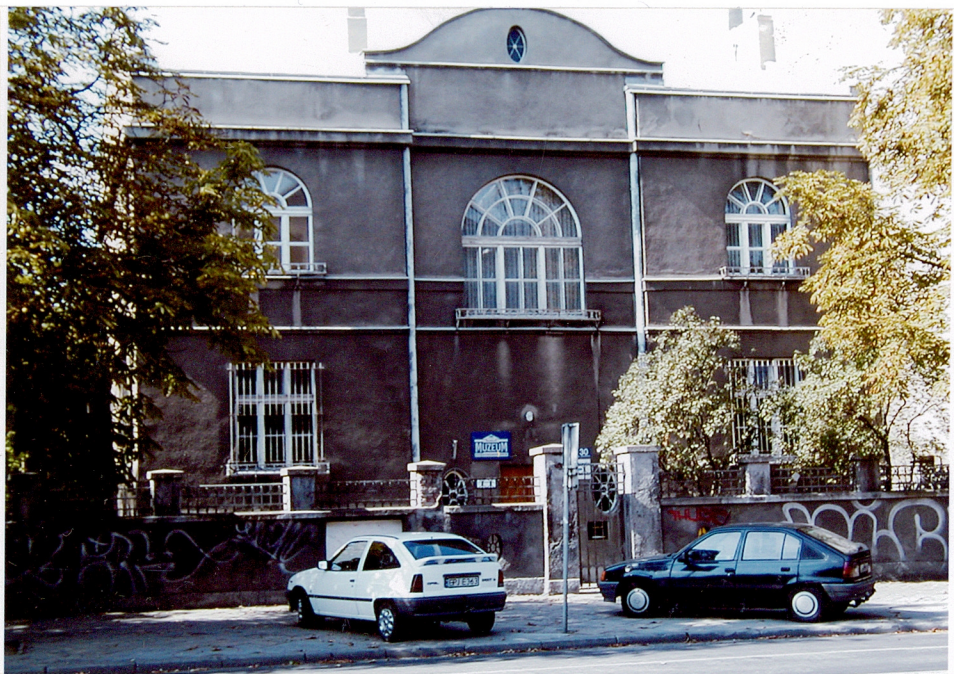
Fot.1. Widok elewacji frontowej budynku.

11. Zdjęcie rzut przekrój sytuacja orientacja