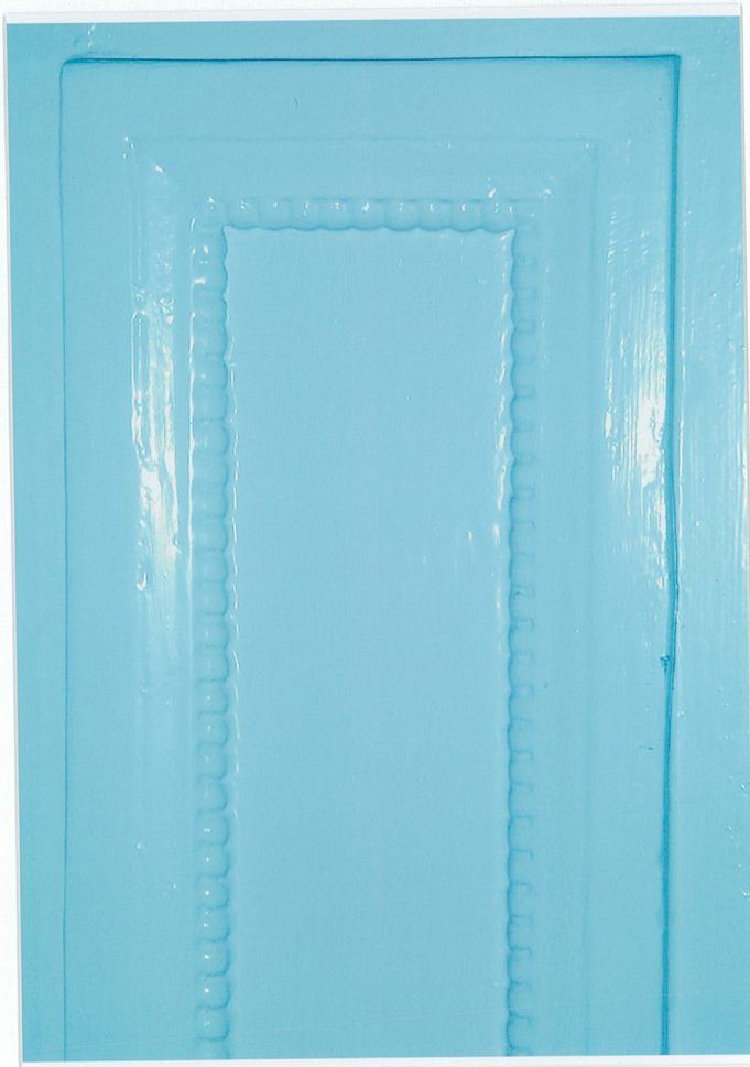
Fot. 25. Detal zdobienia boazerii wewnętrznej