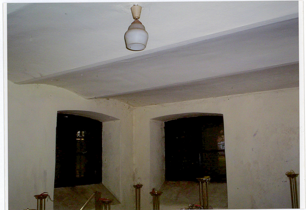
Fot. 16. Wnętrze pomieszczenia piwnicznego