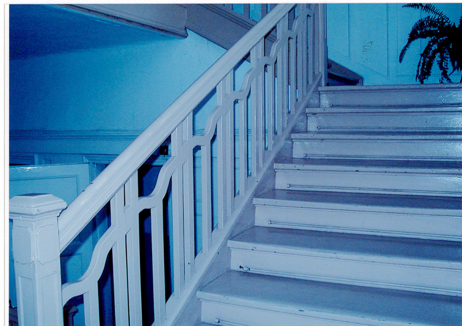
Fot. 18. Balustrada schodów parteru