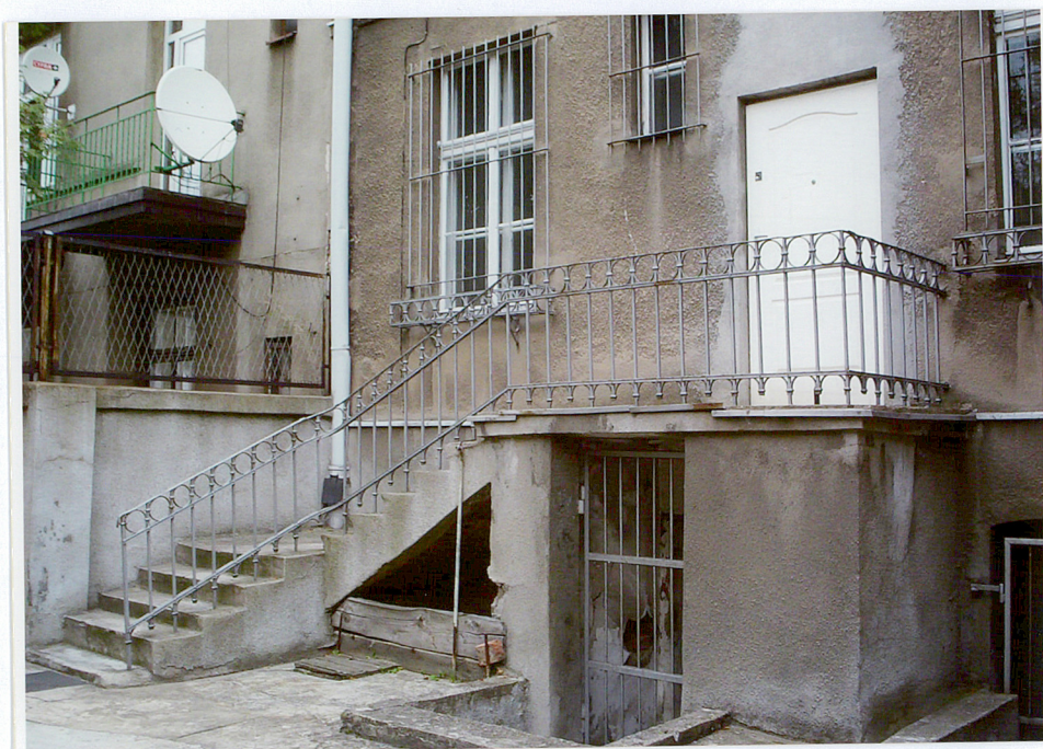
Fot. 6. Elewacja tylna, ganek