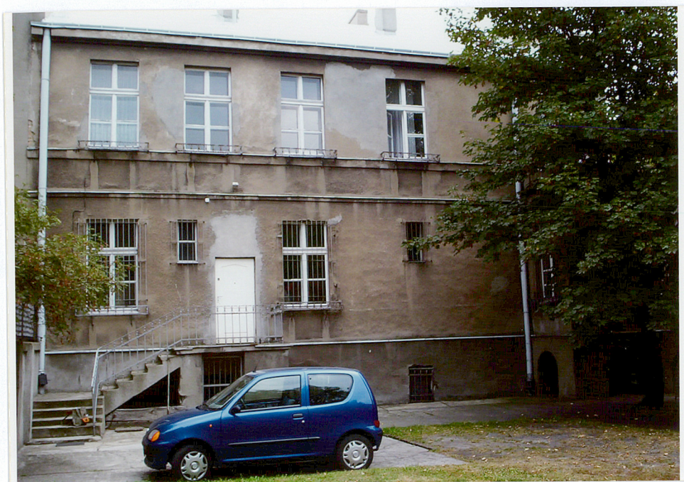
Fot. 5. Elewacja tylna, widok ogólny