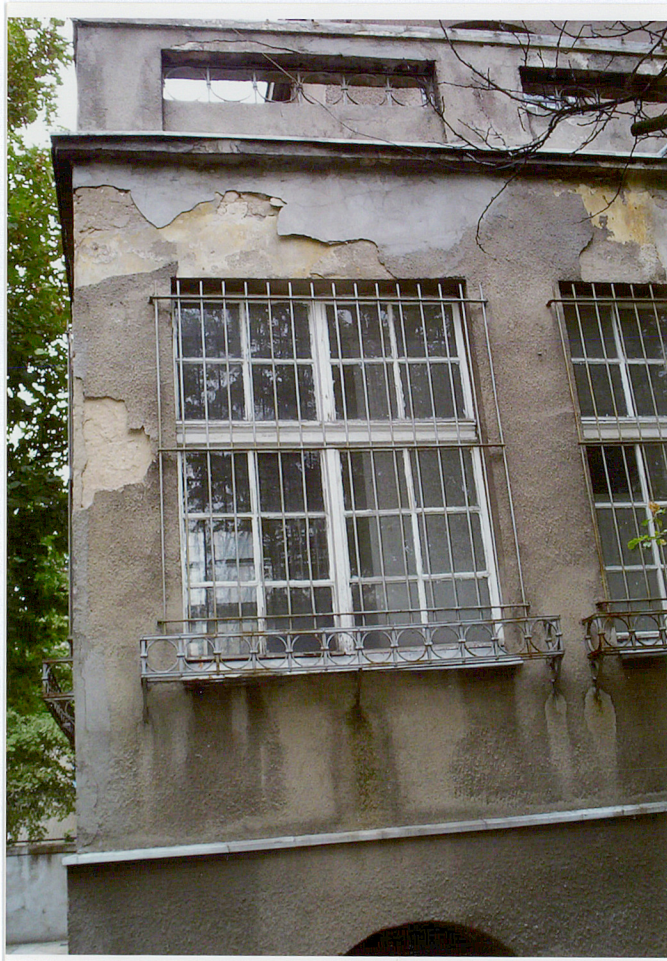
Fot. 7. Naroże południowej ściany werandy