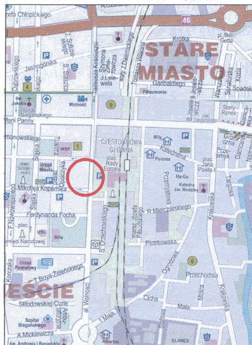
Orientacja, skala 1:20 000