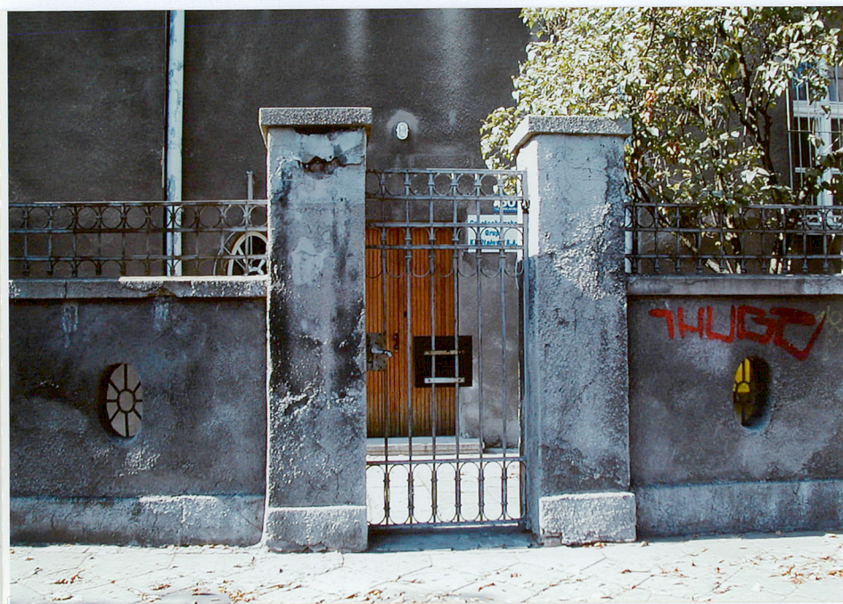
Fot. 13. Furtka w ogrodzeniu od strony ulicy