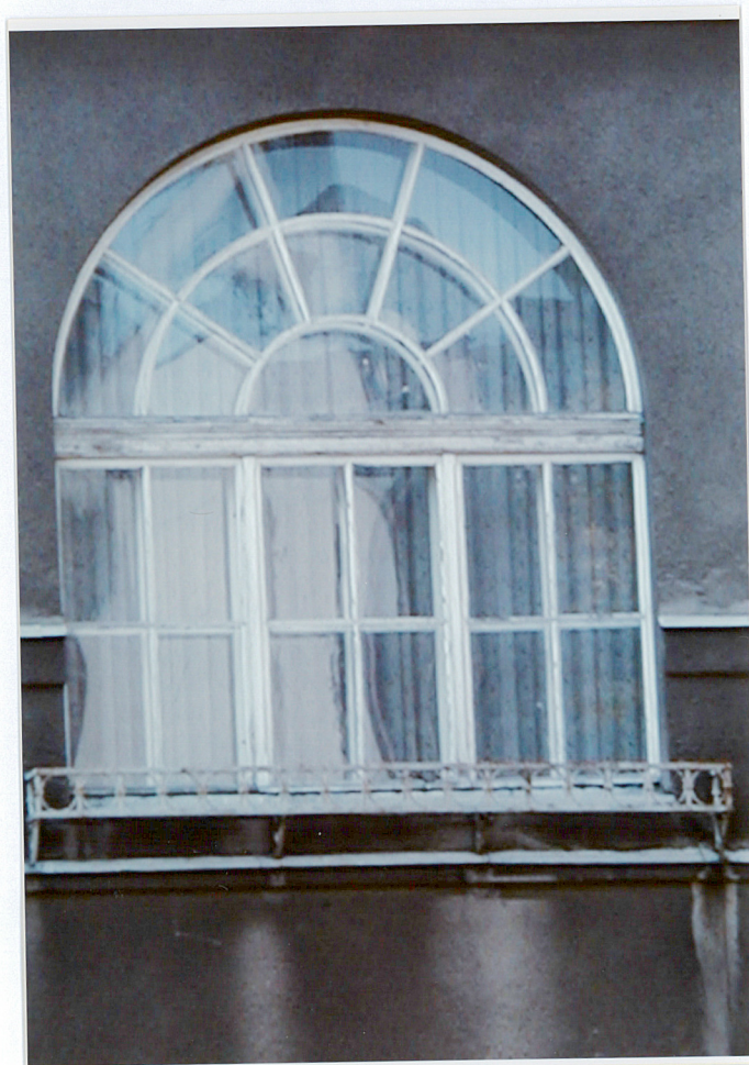
Fot. 10. Okno elewacji frontowej