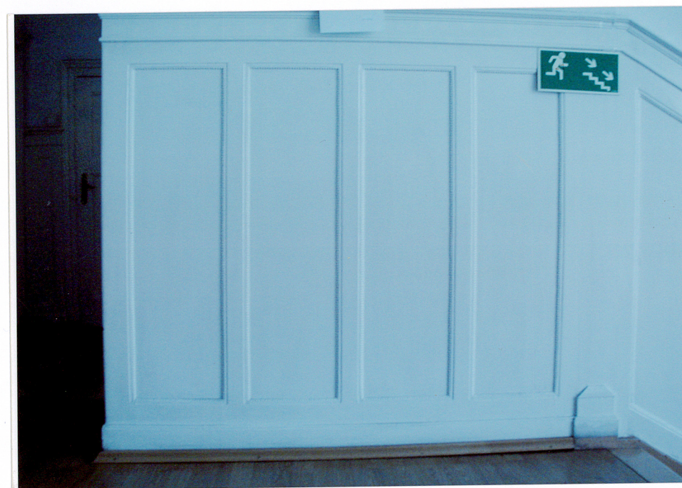
Fot. 20. Boazeria przy schodach