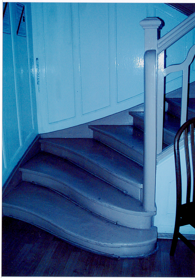
Fot. 17. Schody parteru