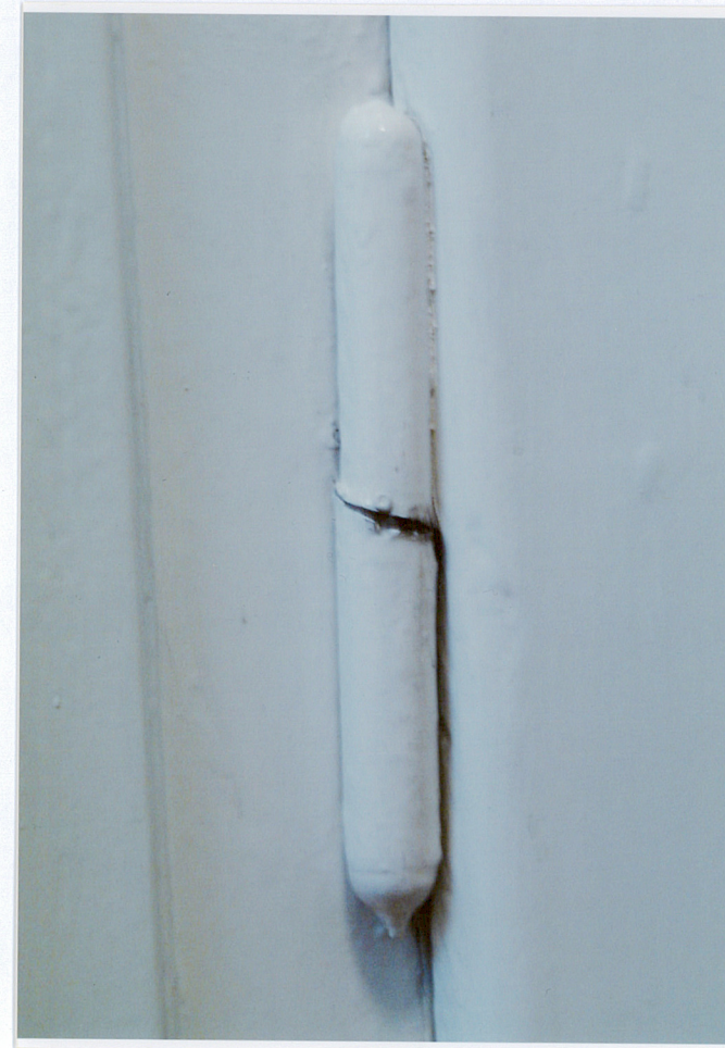
FOT. 2. Oryginalne zawiasy drzwiowe z wążami wpuszczonymi w futrynę i skrzydło drzwiowe

Instalacje – elektryczna, wodno-kanalizacyjna, centralne ogrzewanie, telefoniczna.