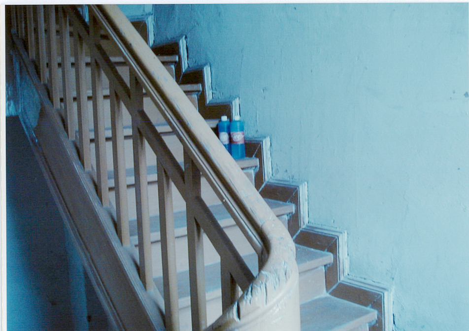
Fot. 23. Schody na strych - policzek