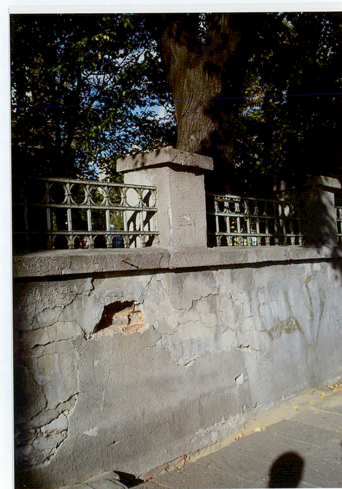
Fot. 14. Fragment ogrodzenia od strony ulicy Focha