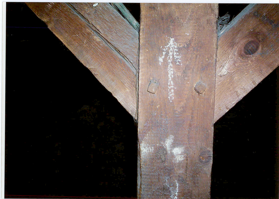
Fot. 28. Wiązary konstrukcji więźby dachowej łączony na kolki