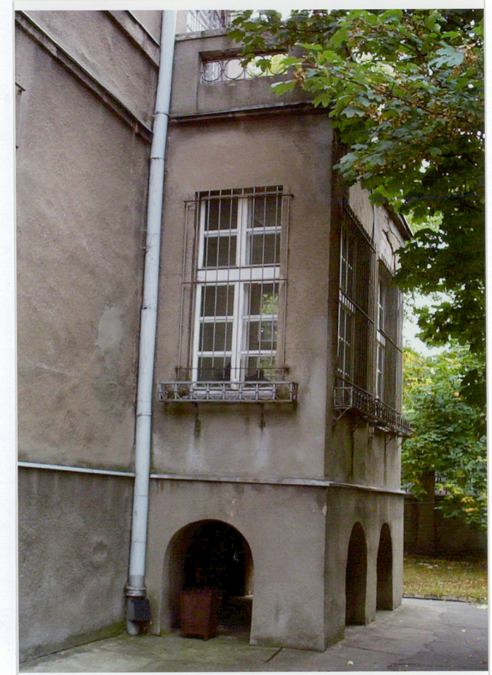
Fot. 9. Północna ściana werandy