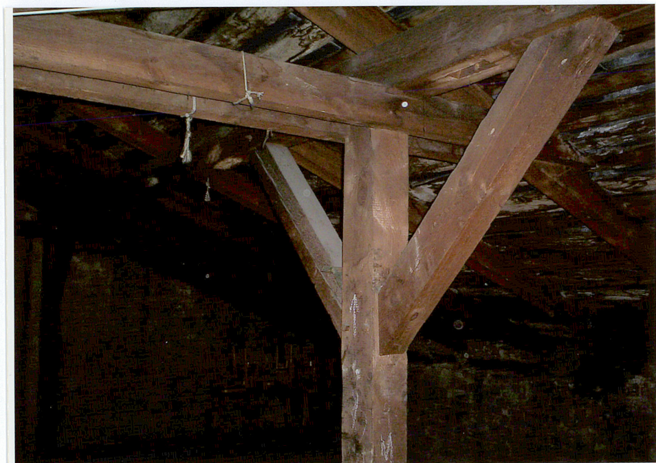
Fot. 26. Wiązar dachowy na poddaszu