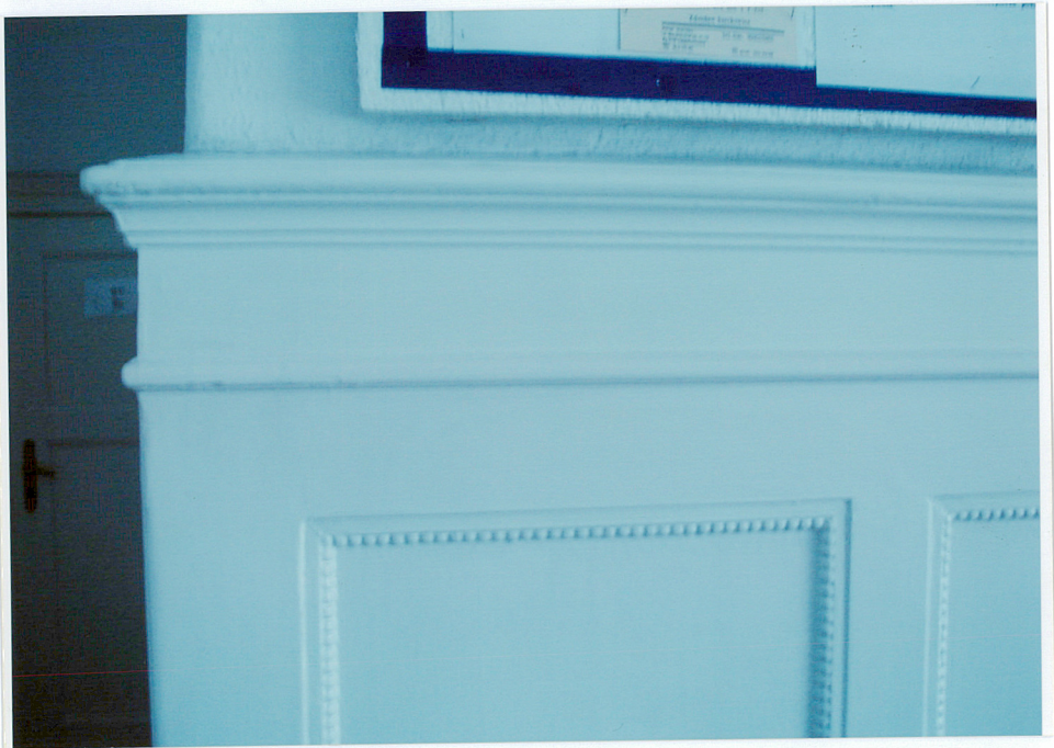
Fot. 21. Boazeria drewniana - zwieńczenie