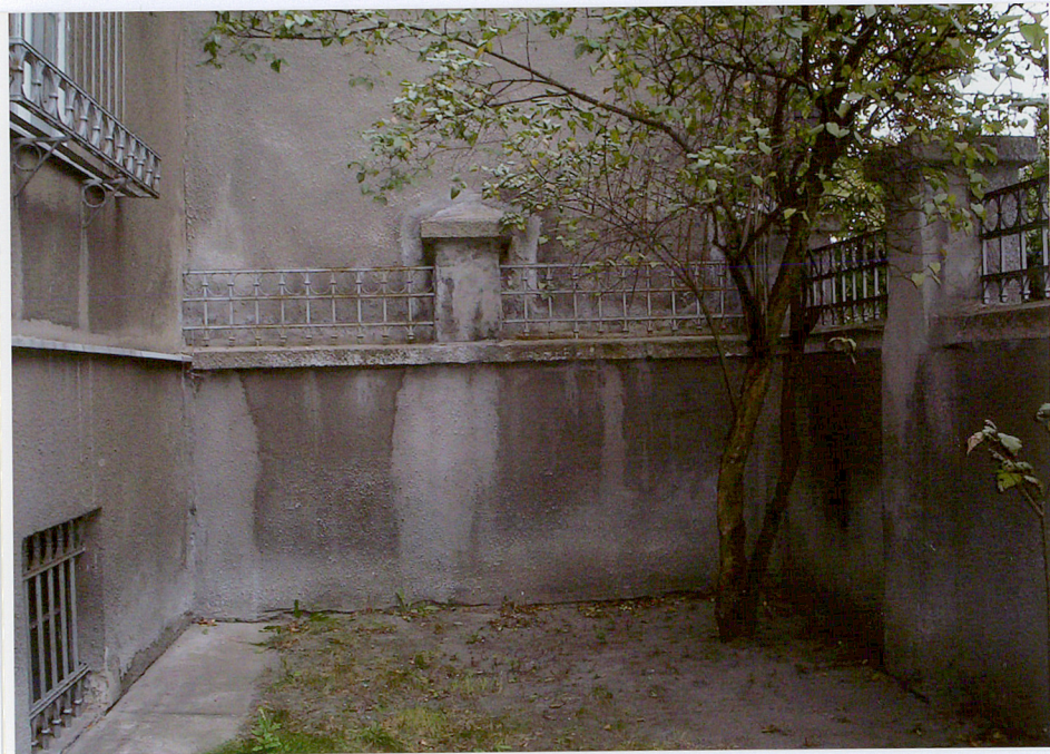
Fot. 15. Wnętrze frontowego ogrodu