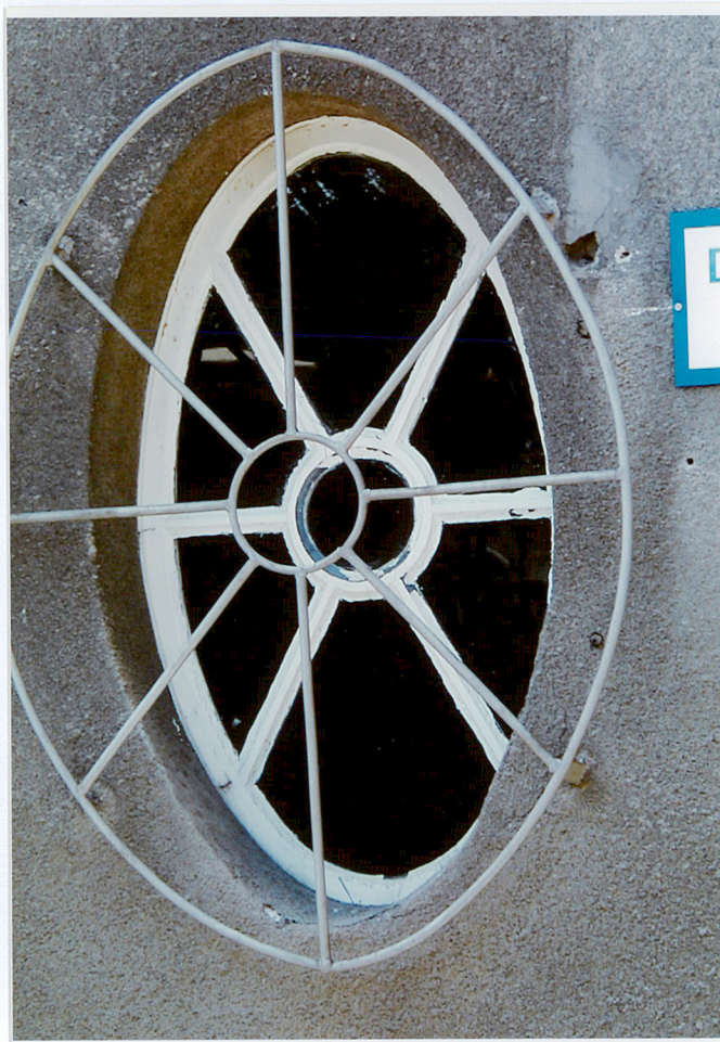
Fot. 11. Okulus przy drzwiach wejściowych na elewacji frontowej