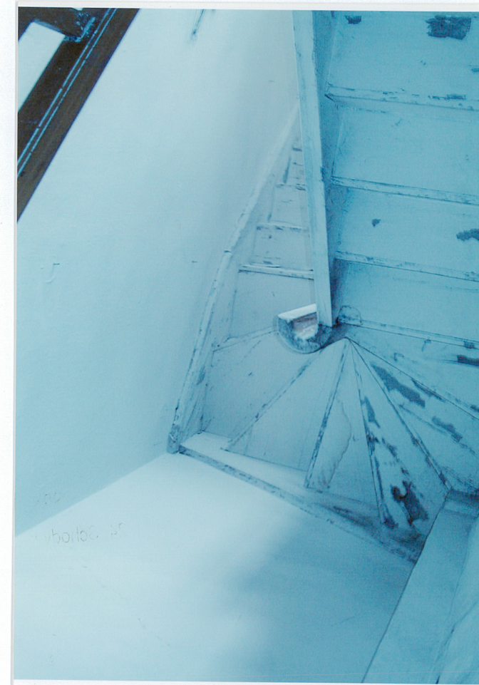
Fot. 24. Schody na strych, tzw. dusza