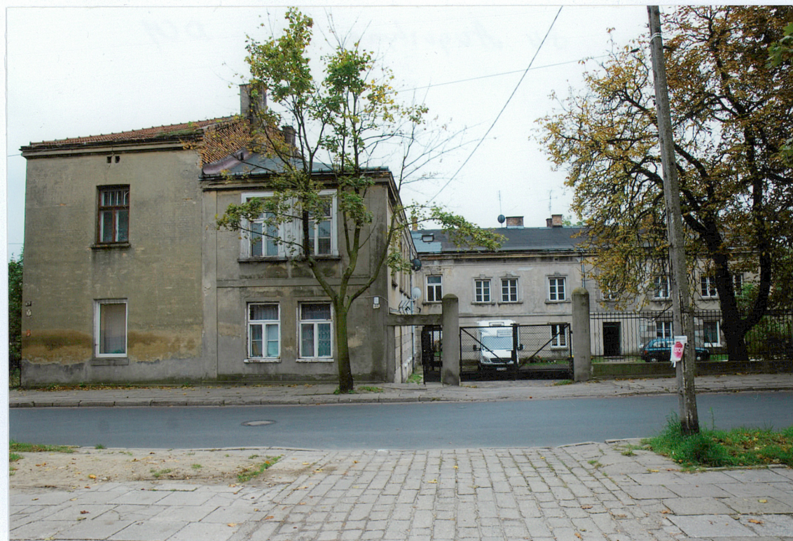
Budynek, widok od strony północnej