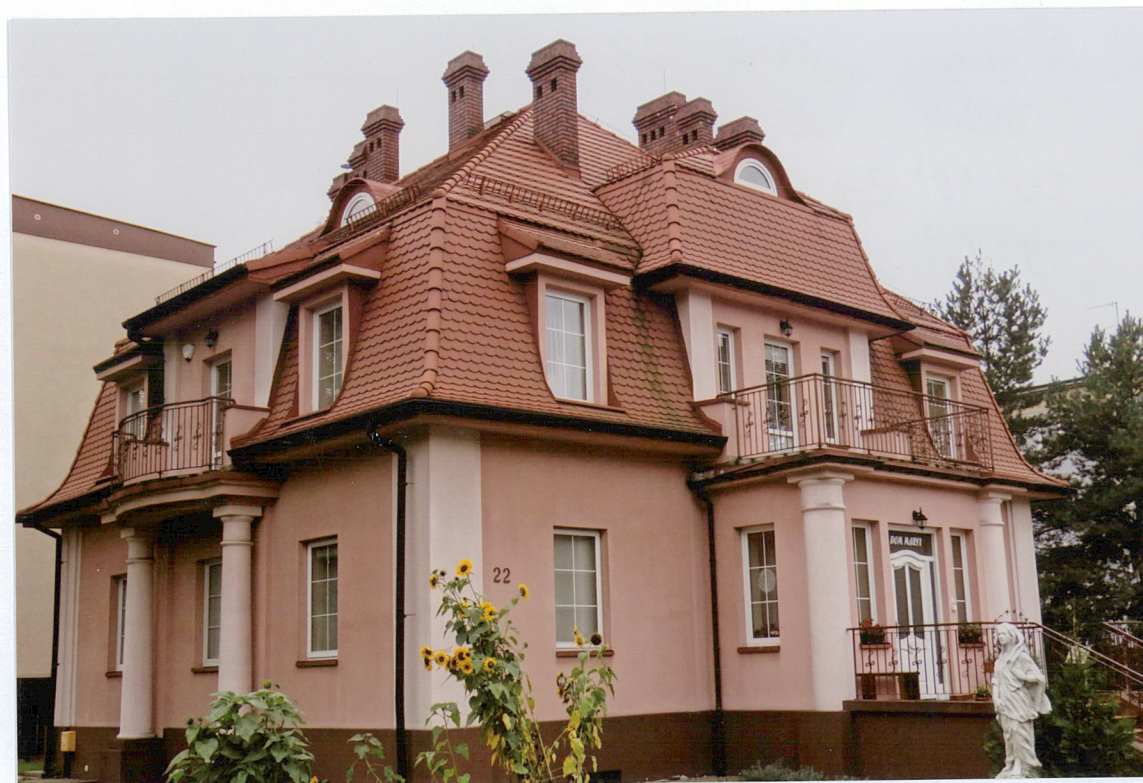
Budynek, widok od strony wschodniej