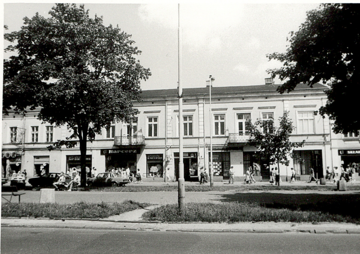
WIDOK OGÓLNY BUDYNKU

11 Zdjęcia: rzut, przekrój, sytuacja, orientacja