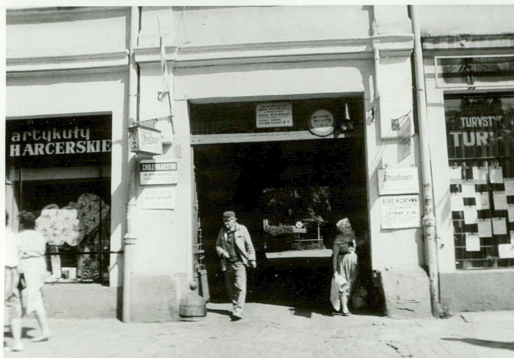
BRAMA PRZEJAZDOWA - SIEN' /W EL. POŁUDNIOWEJ - FRONTOWEJ /