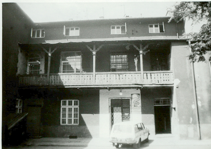
W LEWEJ OFICYNIE DREWNIANA ZADASZONA GALERYZKA