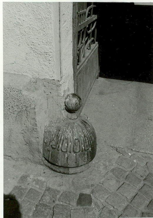
DETAL - LEWY ODBOJNIK W BRAMIE FRONTOWEJ