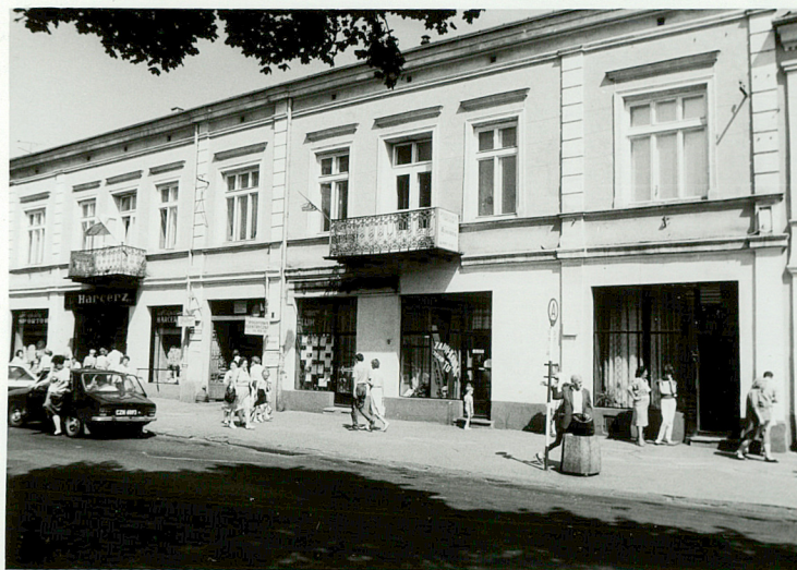
WIDOK OGÓLNY ELEWACJI FRONTOWEJ