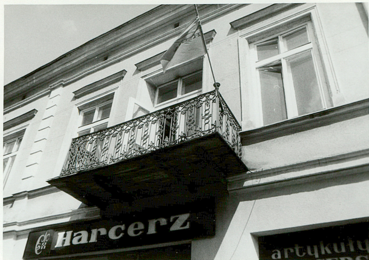
OZDOBNA BALUSTRADA BALKONOWA - EL. PŁD.