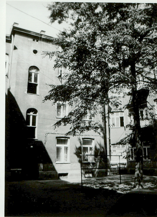
WIDOK II KWADRATOWEGO PODWÓRKA