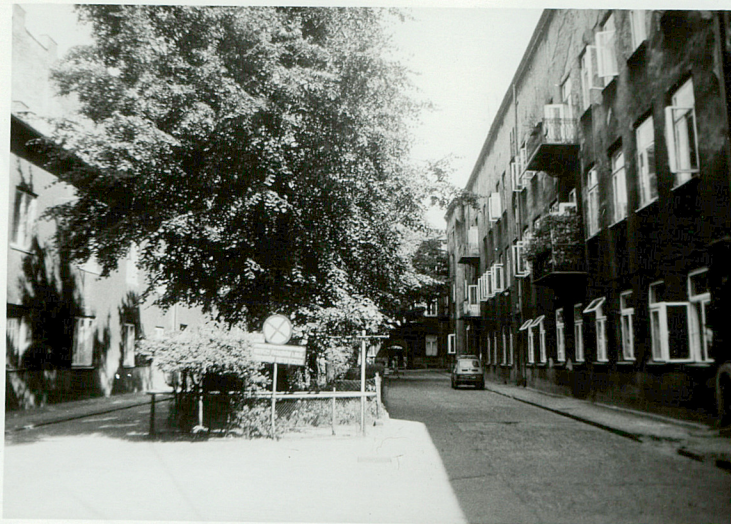
WIDOK I PROSTOKĄTNEGO PODWÓRKA