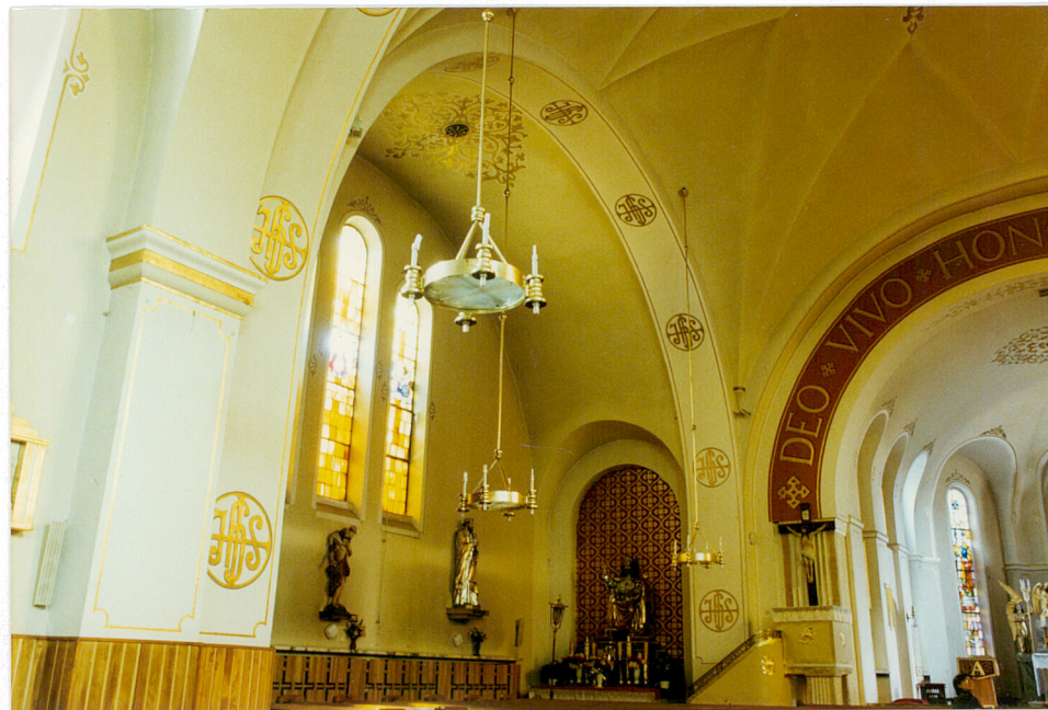
13. Pn. ramię transeptu.