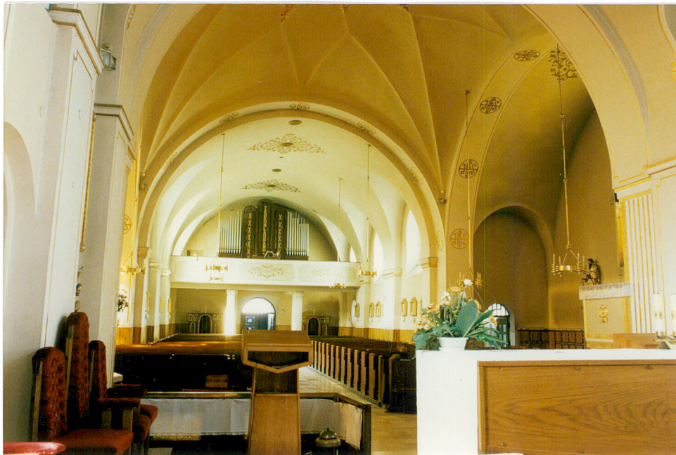
12. Wnętrze – widok ku emporze muz.