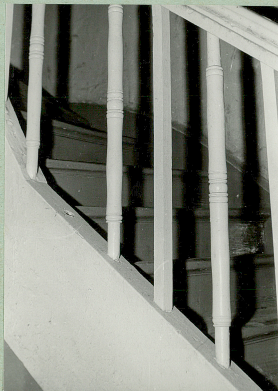
Fragment schodów i balustrady w klatce schodowej oficyny