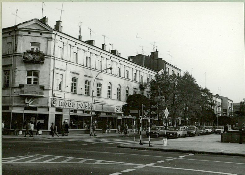
Elewacja skrzydła zachodniego