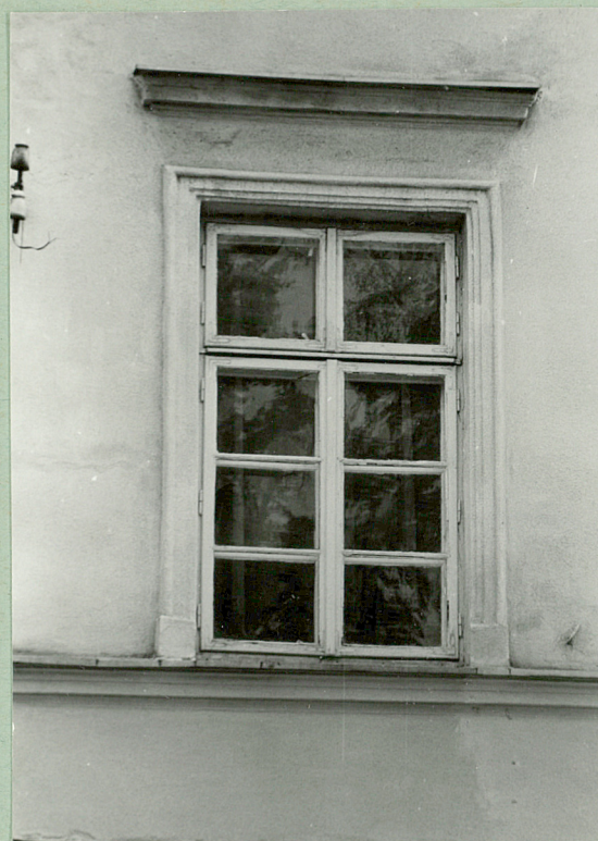
Okno II kondygnacji