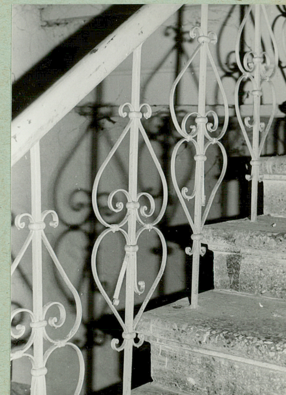
Fragment schodów i balustrady w klatce schodowej oficyny