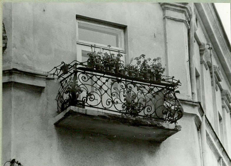
Balkon w elewacji frontowej