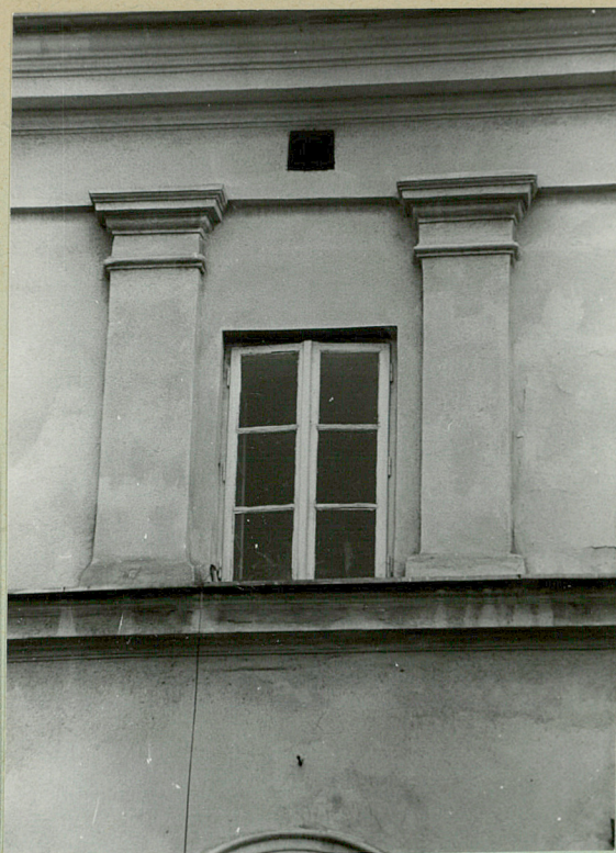
Okno III kondygnacji