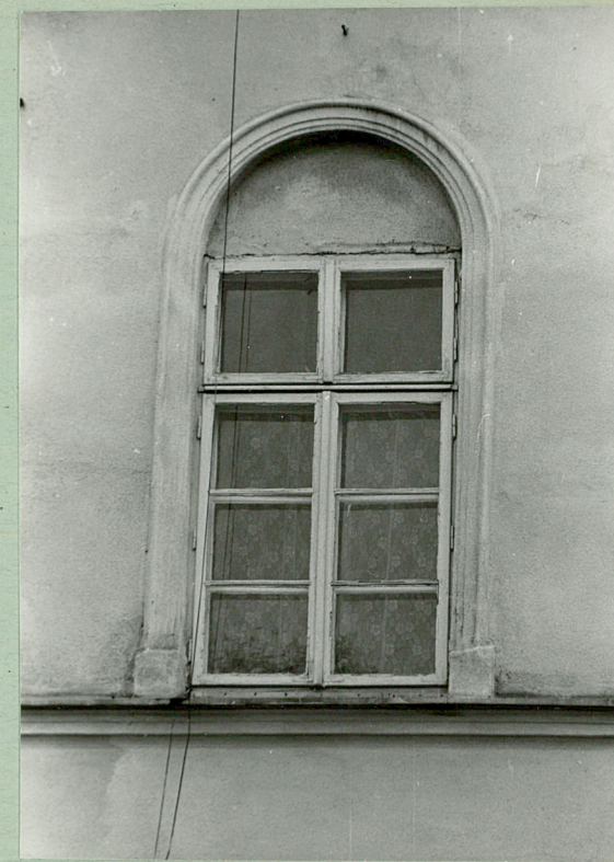
Okno II kondygnacji