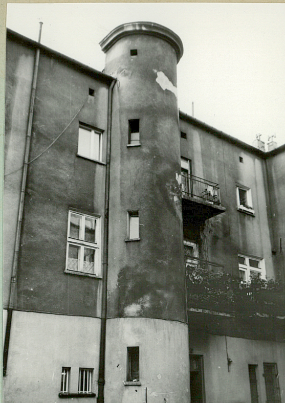
Skrzydło zachodnie, widok od podwórka