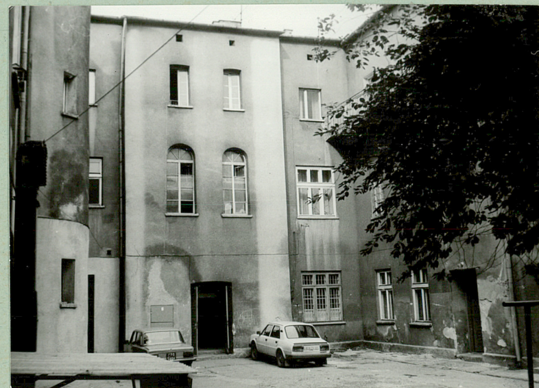
Budynek główny, widok od podwórka