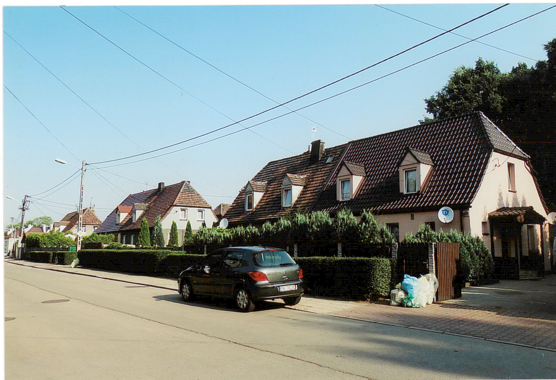
ul. Huberta, widok ogólny