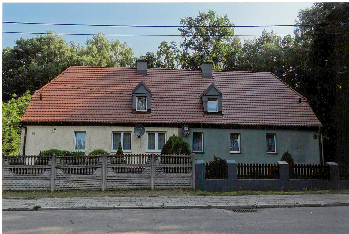
ul. Huberta 56-58, widok od strony POŁUDNIOWEJ