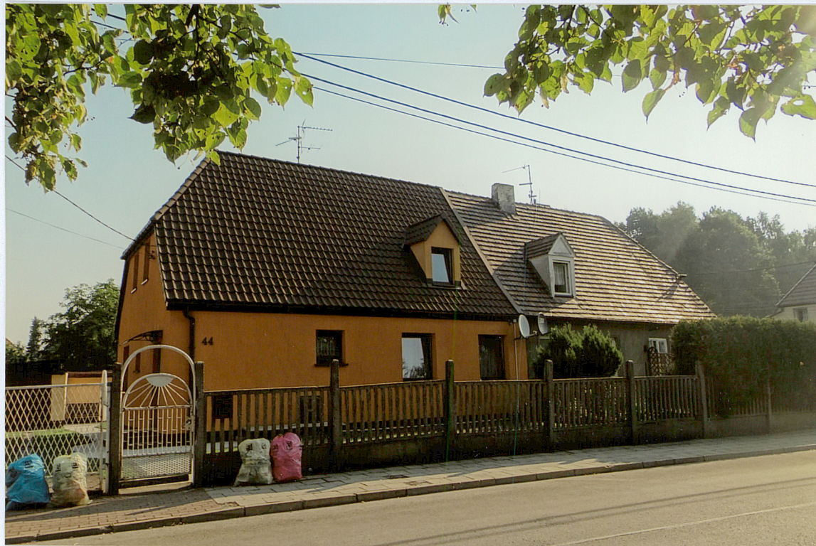
ul. Huberta 44-46, widok od strony POŁUDNIOWO-ZACHODNIEJ