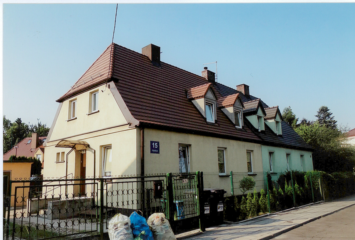
ul. Pawia 15-17, widok od strony PÓŁNOCNO-WSCHODNIEJ

Wkładkę założył: (data i podpis) Irena Kontny, sierpień 2015