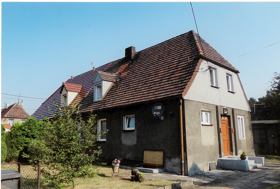
ul. Huberta 48-50, widok od strony POŁUDNIOWEJ