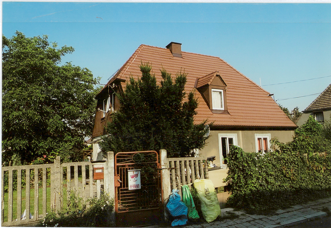
ul. Pawia 3, widok od strony POŁUDNIOWO-WSCHODNIEJ