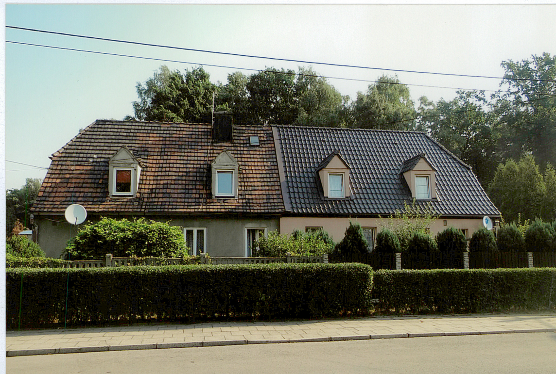
ul. Huberta 52-54, widok od strony POŁUDNIOWEJ