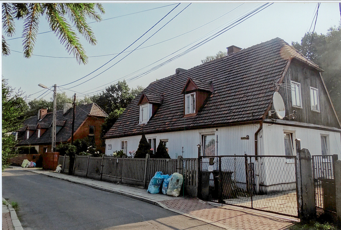
ul. Pawia 2-4, widok od strony POŁUDNIOWO-ZACHODNIEJ