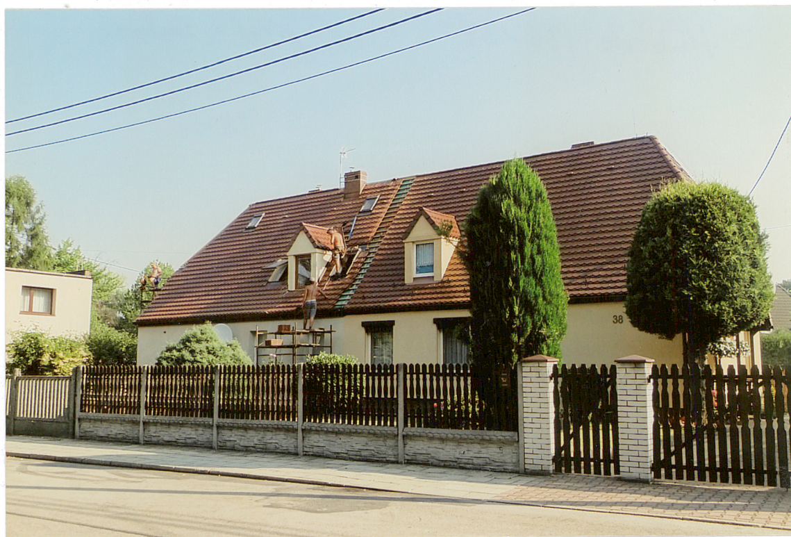
ul. Huberta 36-38, widok od strony POŁUDNIOWO-ZACHODNIEJ