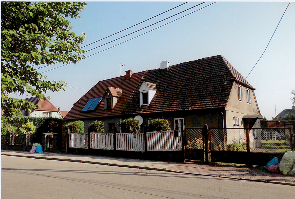
ul. Huberta 40-42, widok od strony POŁUDNIOWEJ