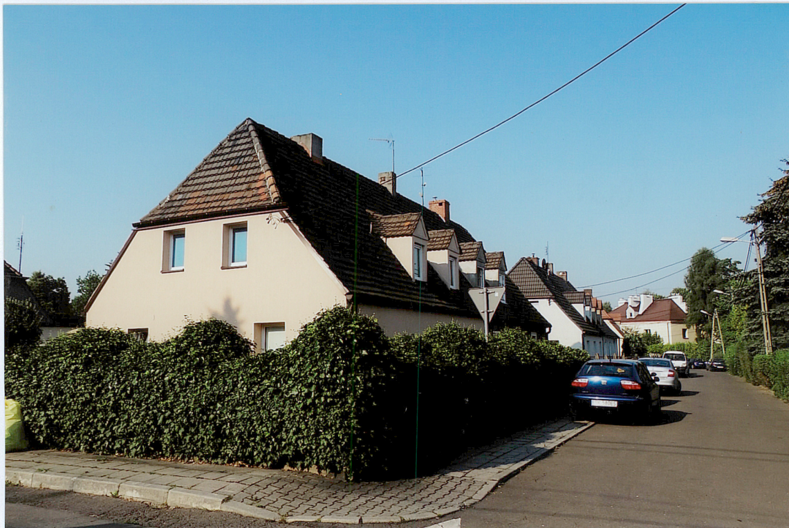
ul. Pawia 7-9, widok od strony PÓŁNOCNO-WSCHODNIEJ