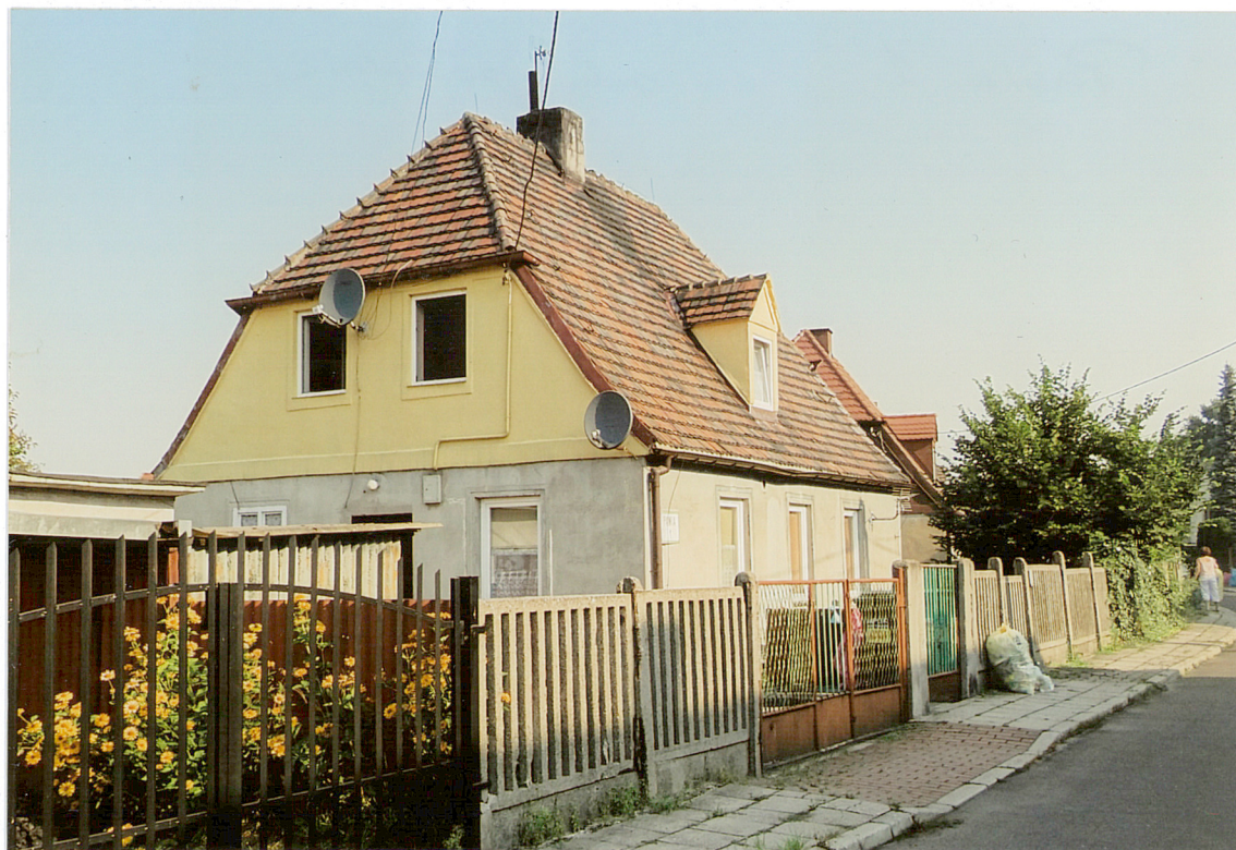
ul. Pawia 1, widok od strony POŁUDNIOWEJ