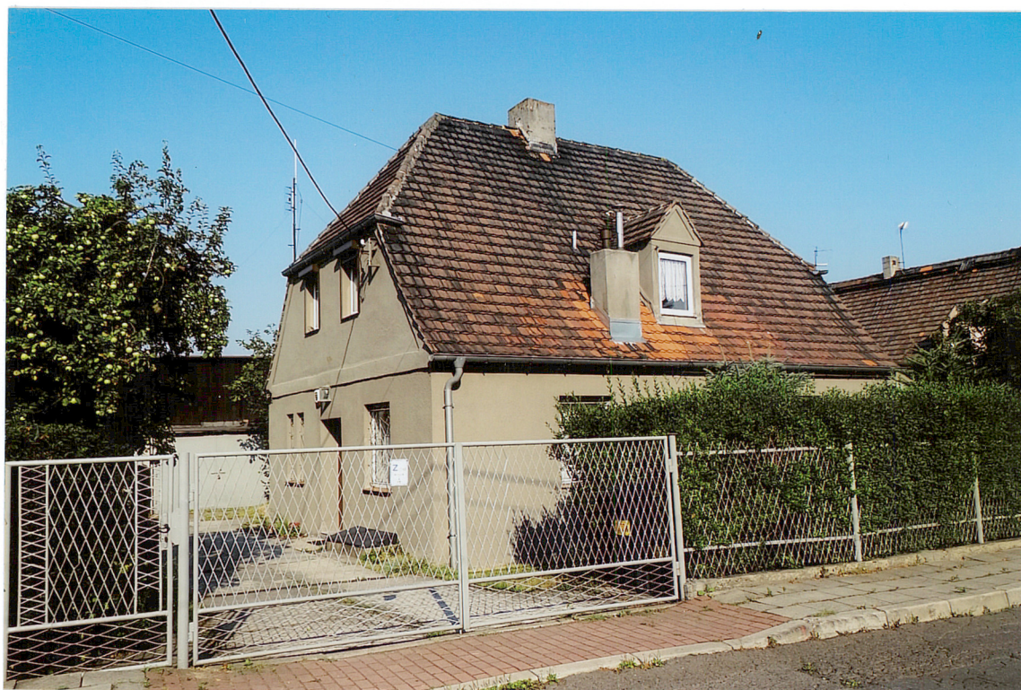
ul. Pawia 5, widok od strony POŁUDNIOWO-WSCHODNIEJ