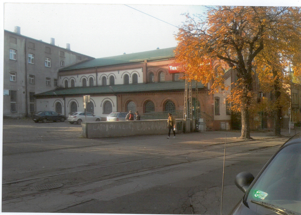
Widok od pn./wsch