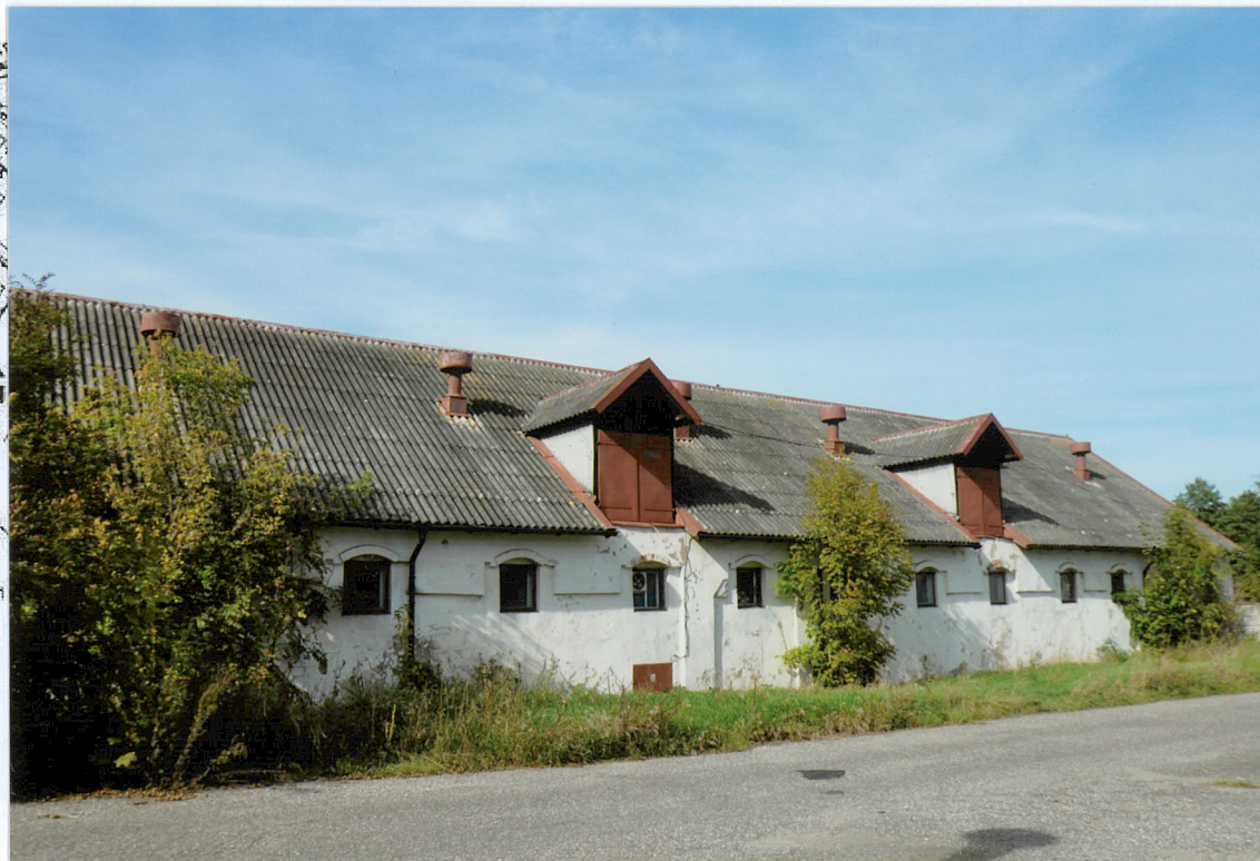
Budynek, widok od strony południowo-wschodniej